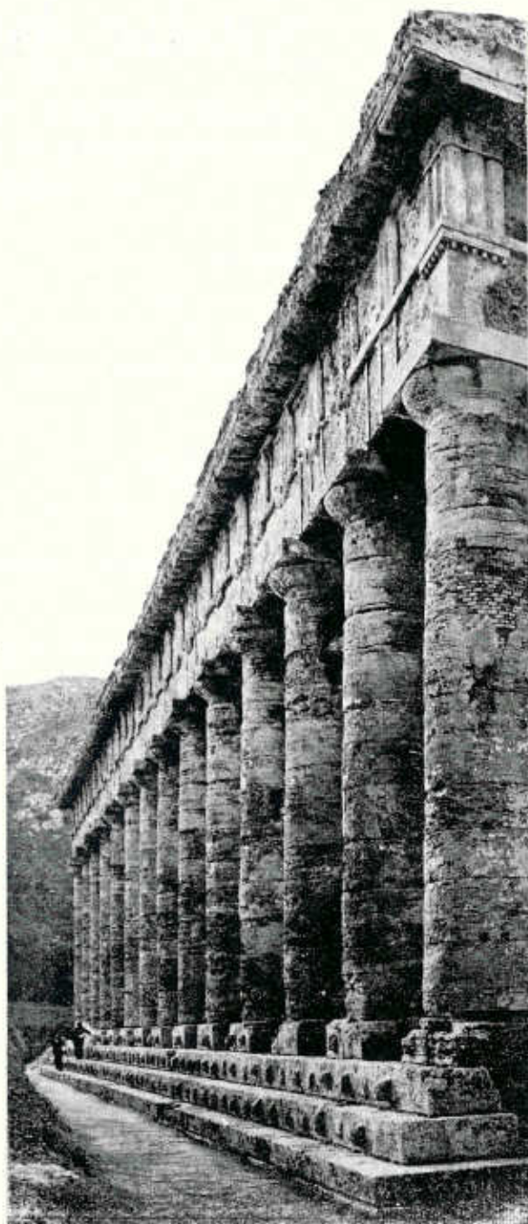
Segesta: Tempio dorico