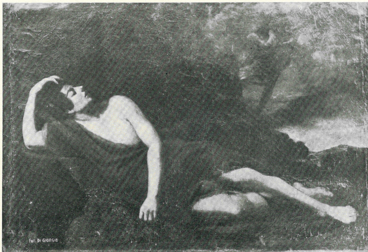
ANDREA CARRECA - Il sogno di Giacobbe - Sec. XVII. Trapani, R. Museo.