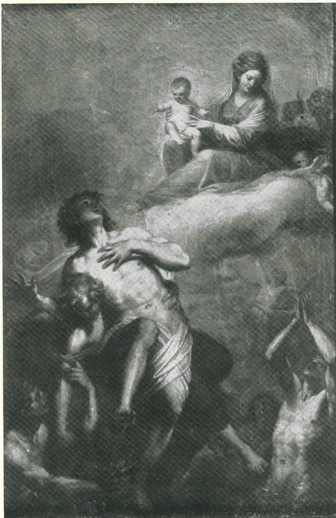
ERRANTE GIUSEPPE - Anime del Purgatorio - Sec. XIX - Trapani, R. Museo.