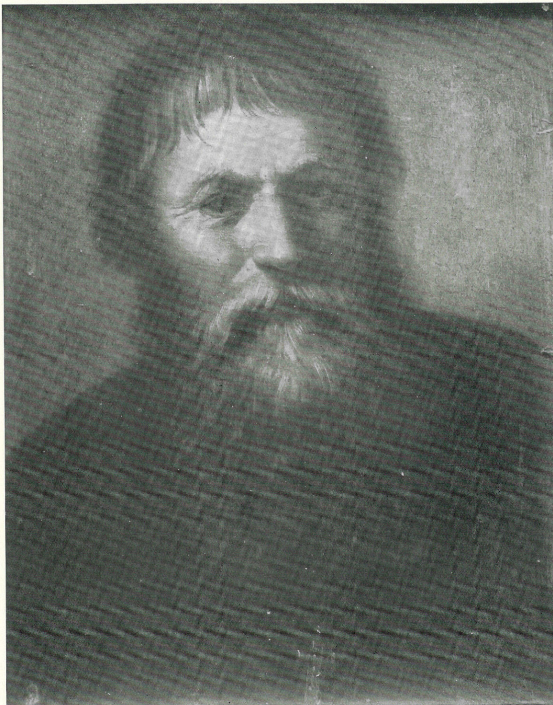
ERRANTE GIUSEPPE - Testa virile - Sec. XIX - Palermo, Museo Nazionale.