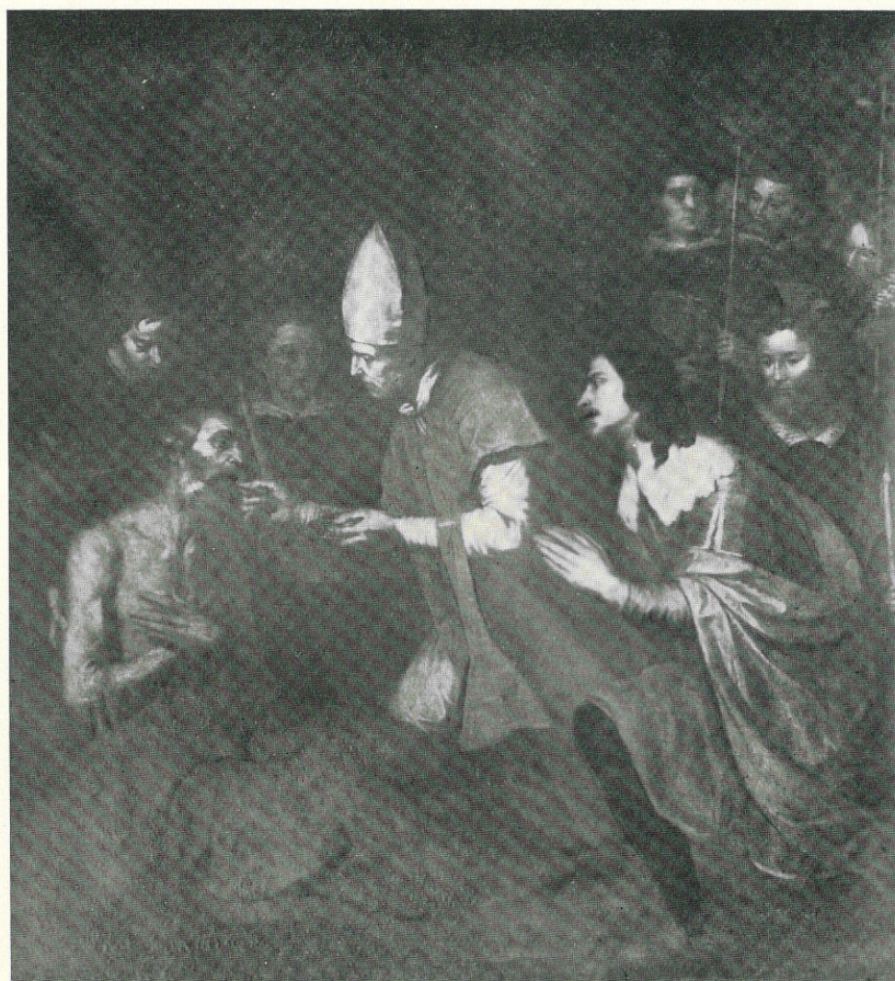
G. LO VERDE - L'ultima comunione di S. Girolamo - Sec. XVII. Catania, Museo Comunale.