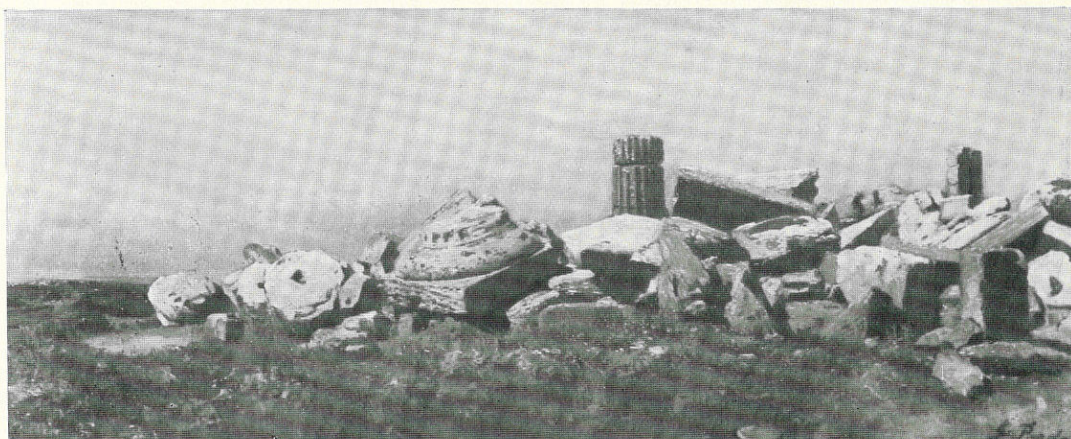
PARDO GENNARO - Rovine di Selinunte - Sec. XIX - Trapani, Collezione G. Venuti.