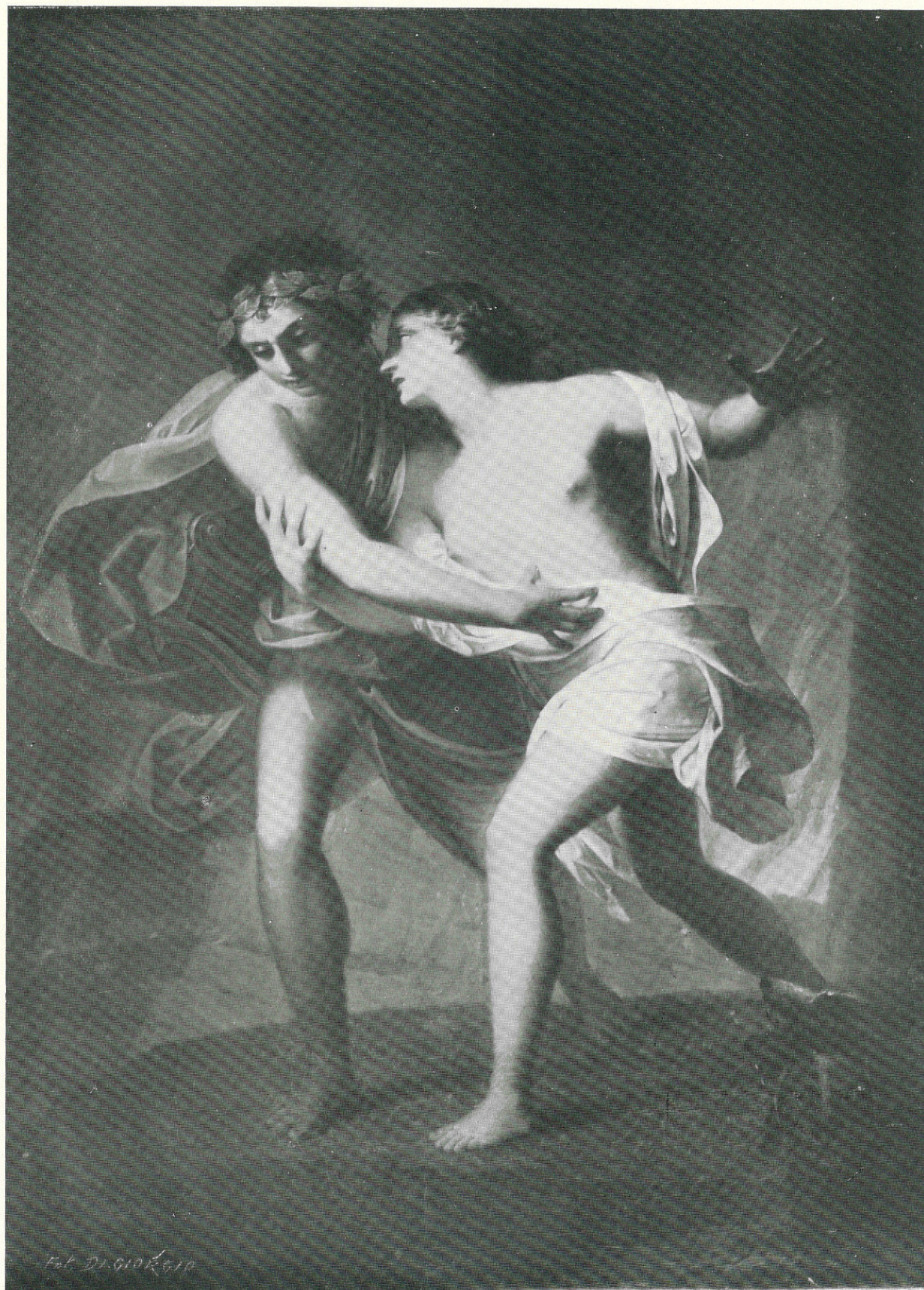
ERRANTE GIUSEPPE - Orfeo ed Euridice - Sec. XIX - Trapani, Palazzo del Comune.