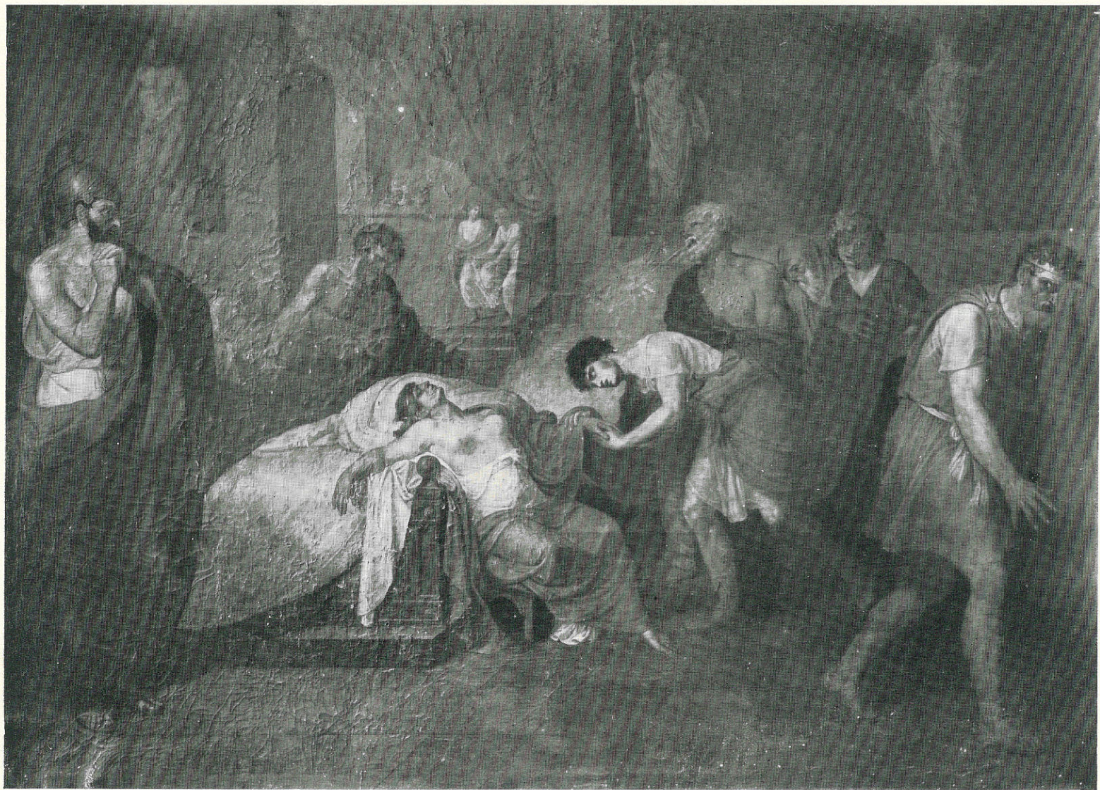
ERRANTE GIUSEPPE - La morte di Antigone - Sec. XIX - Trapani, R. Museo.