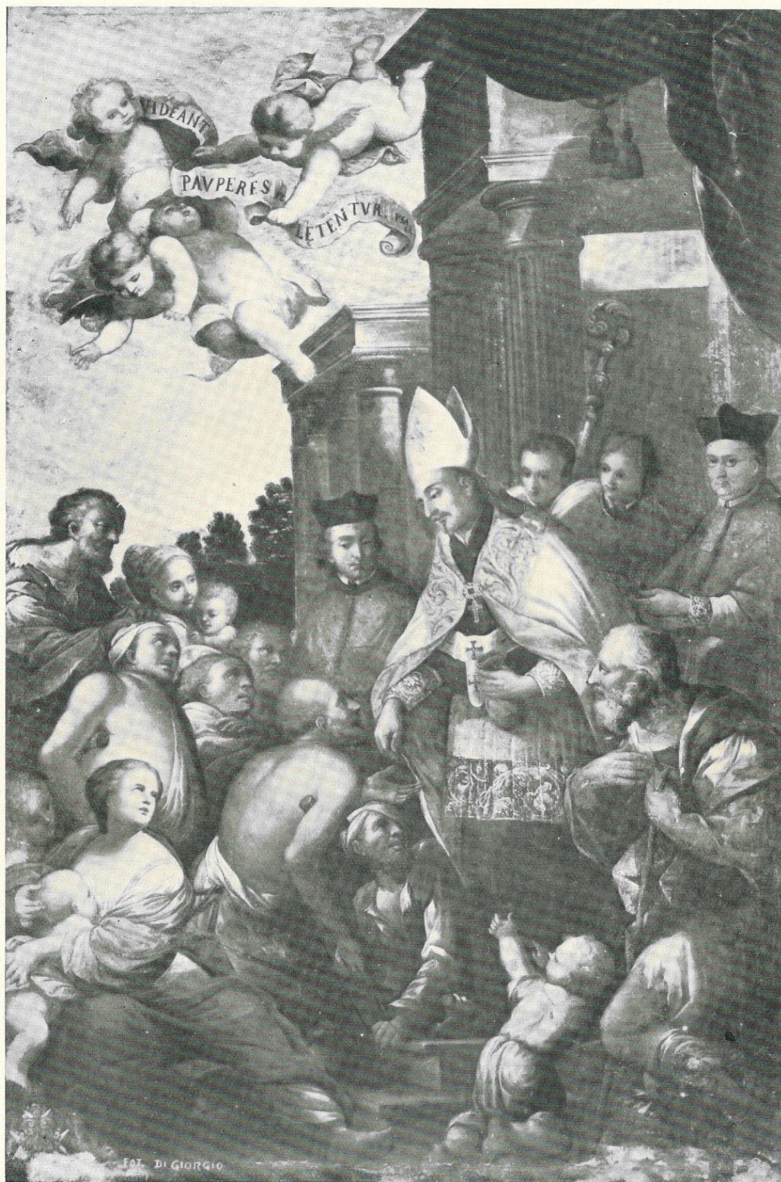
LA FRANCESCA GIUSEPPE - S. Tommaso di Villanova - Sec. XVII - Trapani, R. Museo.