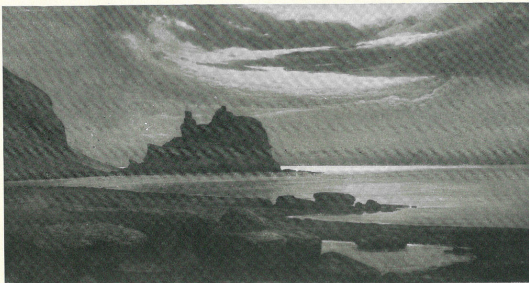
SAPORITO GIUSEPPE - Marettimò: Notte di luna - Sec. XX - Trapani, Coll. Saporito.