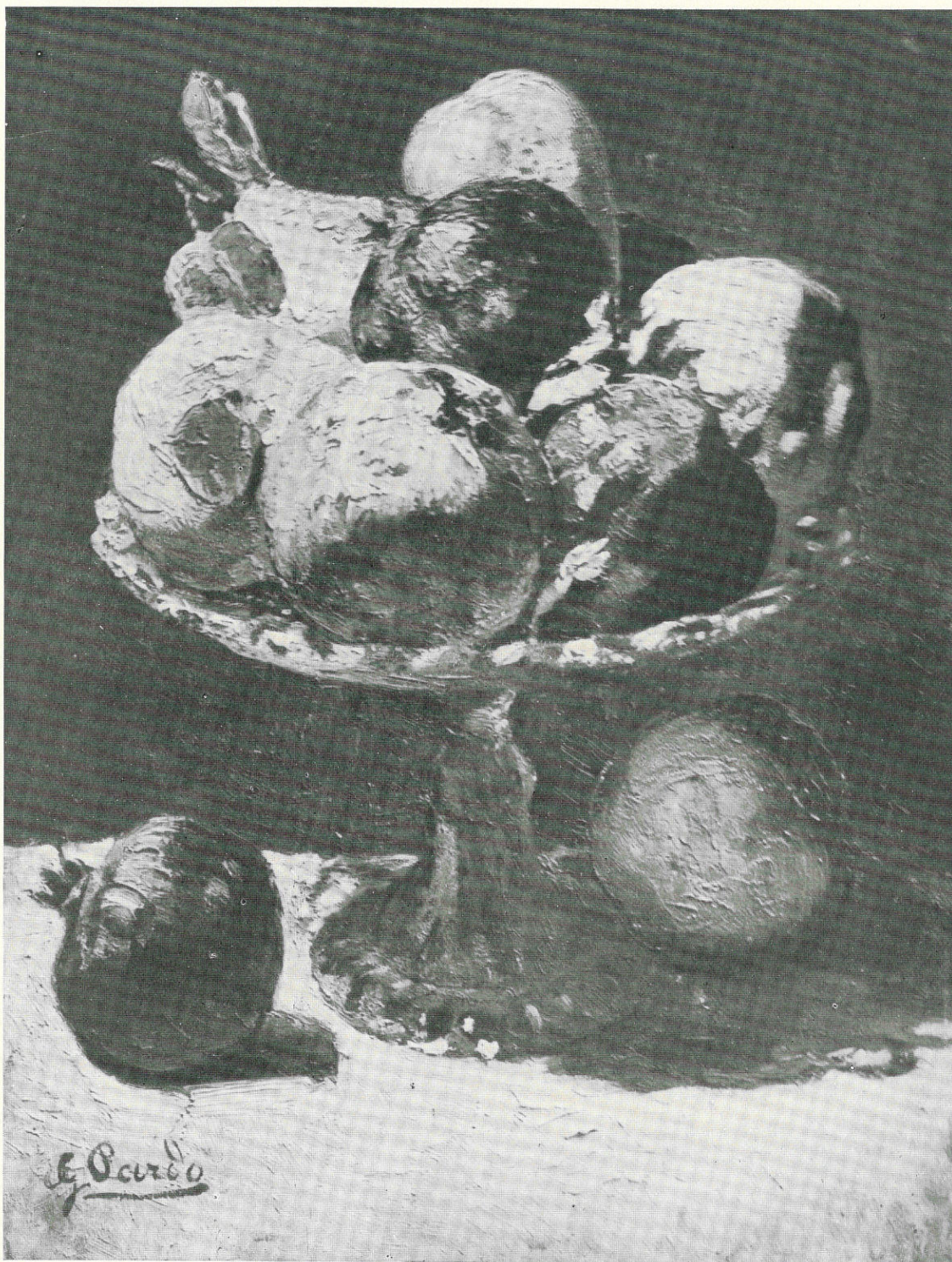
PARDO GENNARO - Natura morta - Sec. XIX - Castelvetrano, Famiglia Pardo.