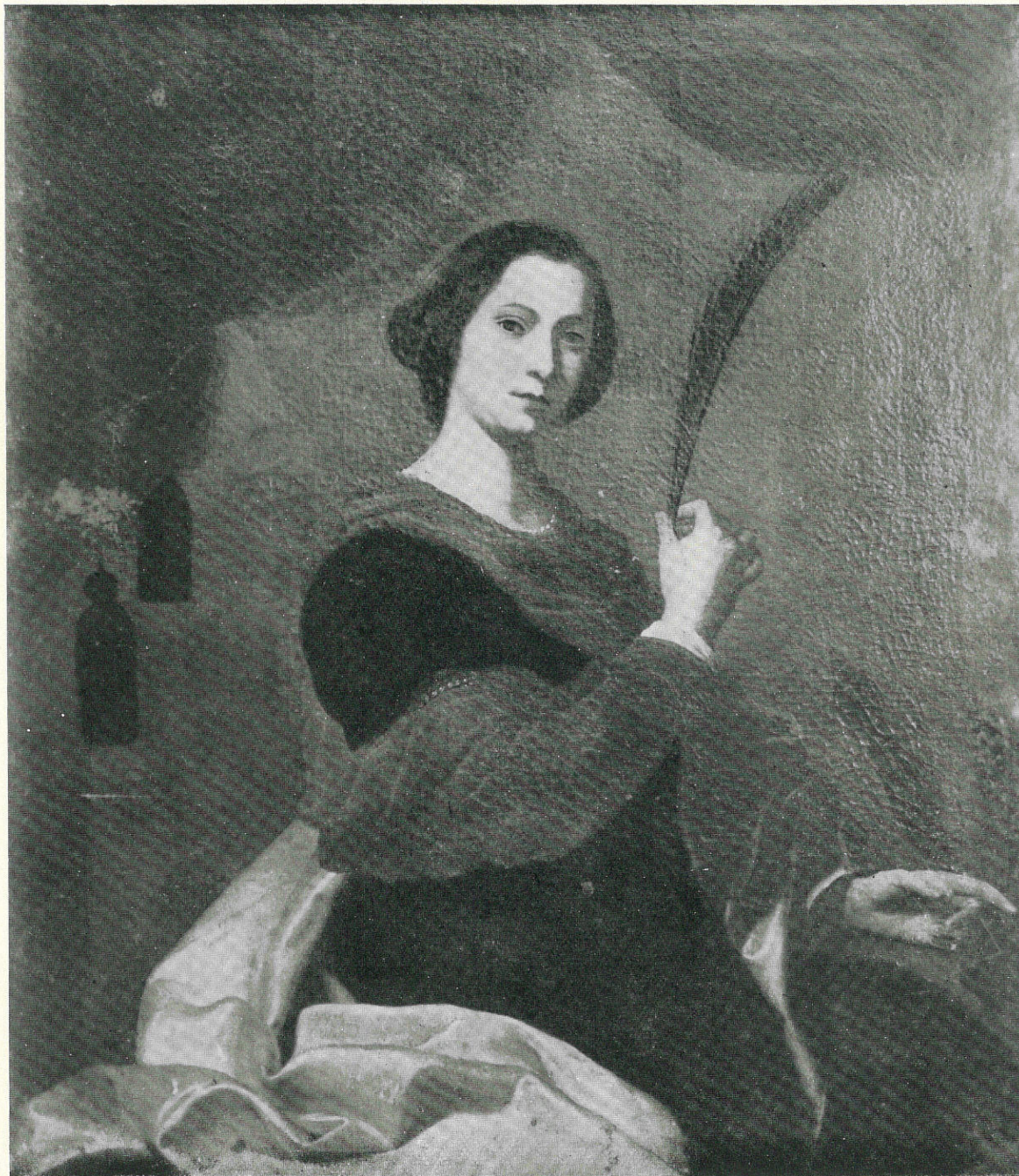
G. Lo VERDE - Santa Caterina d'Alessandria - Sec. XVII - Palermo, Museo Nazionale.