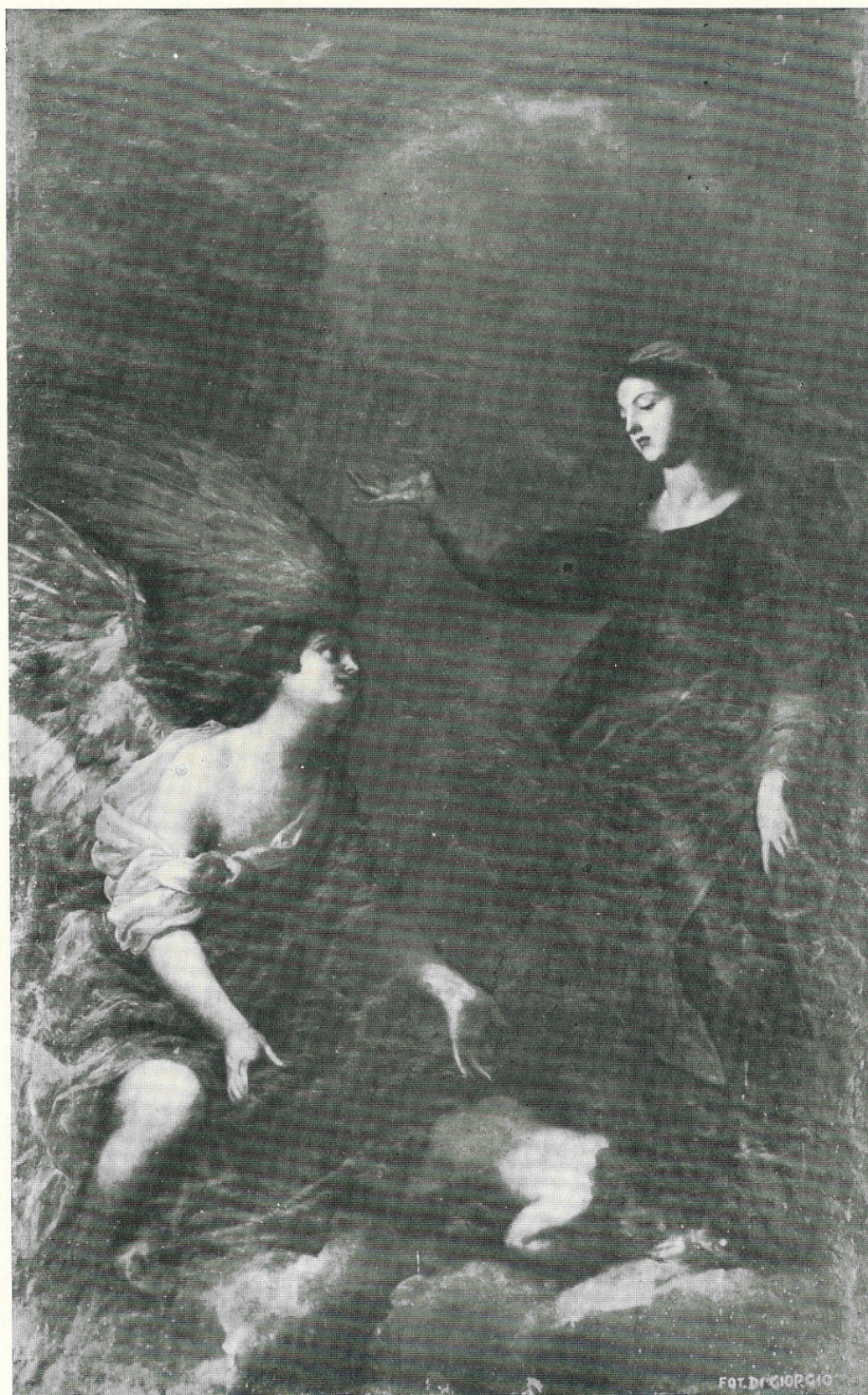
ANDREA CARRECA - L'Angelo Custode - Sec. xvii - Trapani, R. Museo.