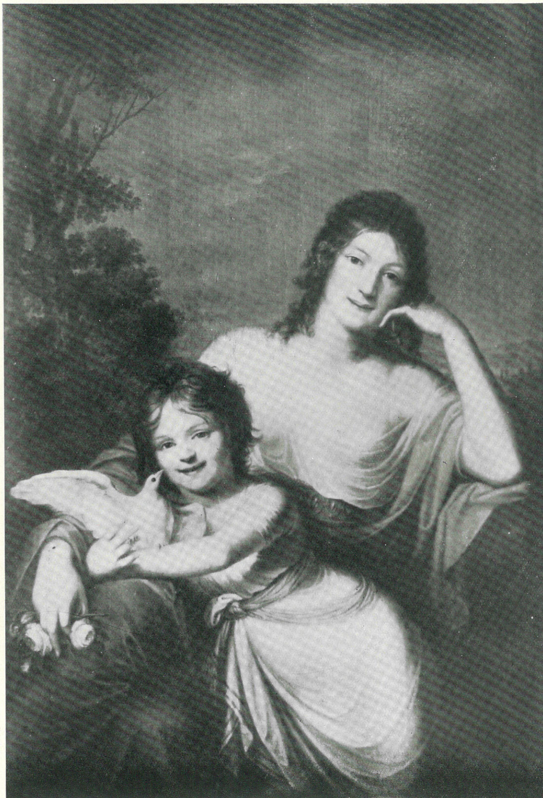
ERRANTE GIUSEPPE - Madama Gherardi e la figlia - Sec. XIX. Modena, Collezione Ricci.