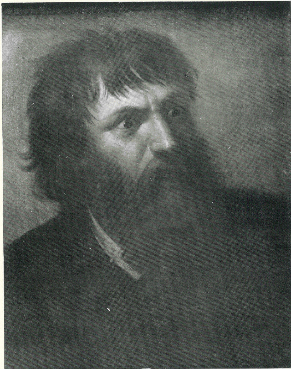
ERRANTE GIUSEPPE - Testa virile - Sec. XIX - Palermo, Museo Nazionale.