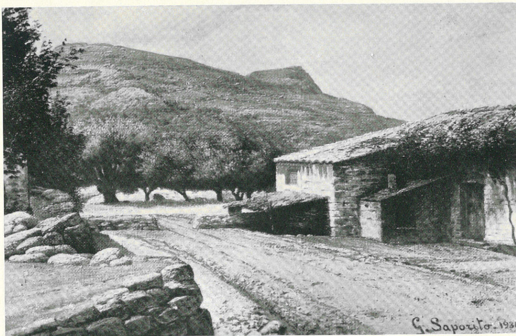
SAPORITO GIUSEPPE - Paesaggio - Sec. XX - Trapani, Collezione Saporito.