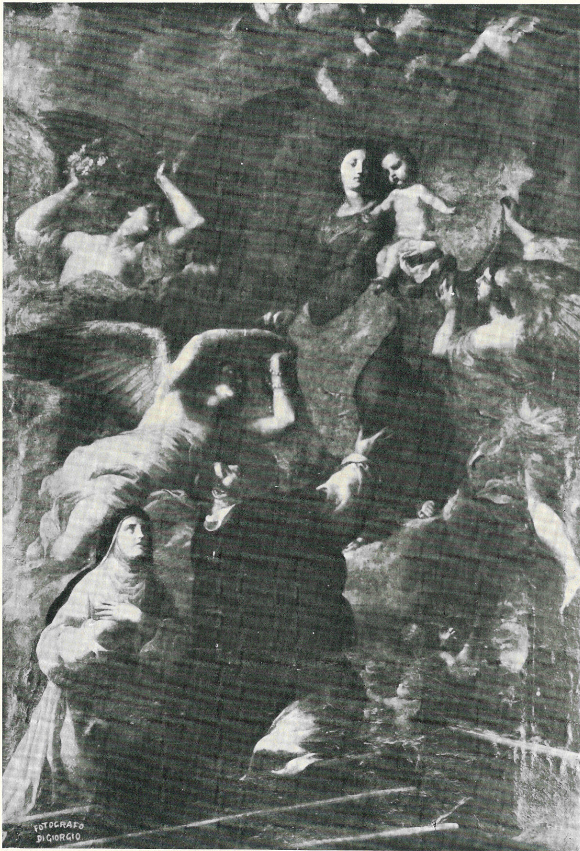
ANDREA CARRECA - La Madonna, S. Domenico e S. Caterina da Siena - Sec. XVII. Trapani, R. Museo.