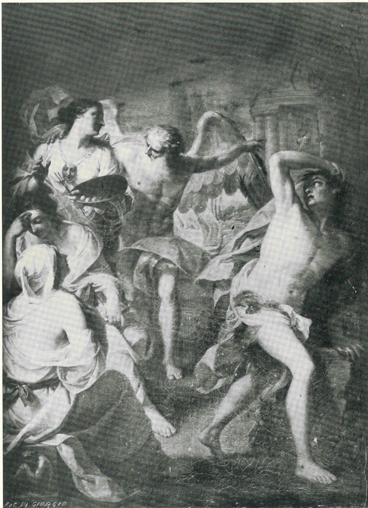
ERRANTE GIUSEPPE - Il Tempo indica alle Arti Belle il Tempio della gloria - Sec. XIX Trapani, Palazzo del Comune.