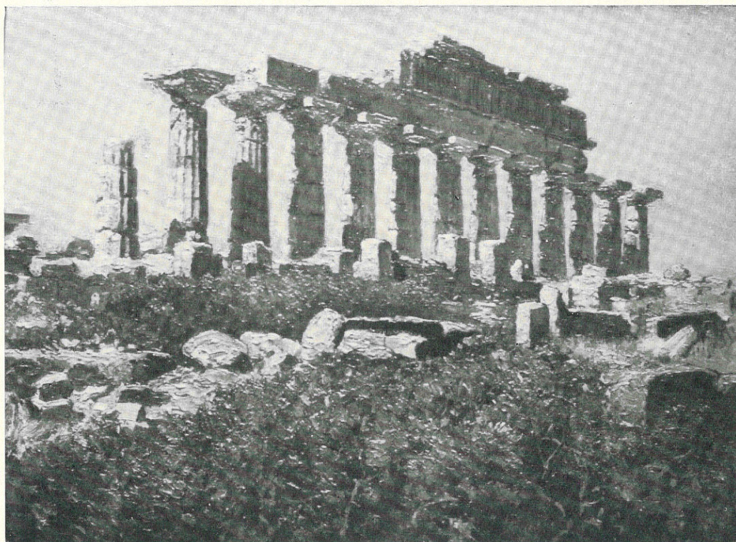
PARDO GENNARO - Il Tempio di Selinunte - Sec. XIX - Trapani, Collezione G. Venuti.