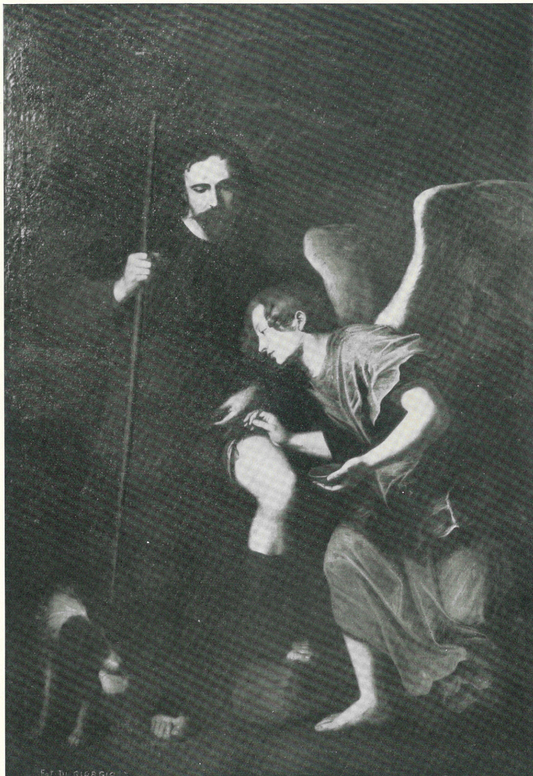
G. LO VERDE - S. ROCCO - SEC. XVII - TRAPANI - R. MUSEO.