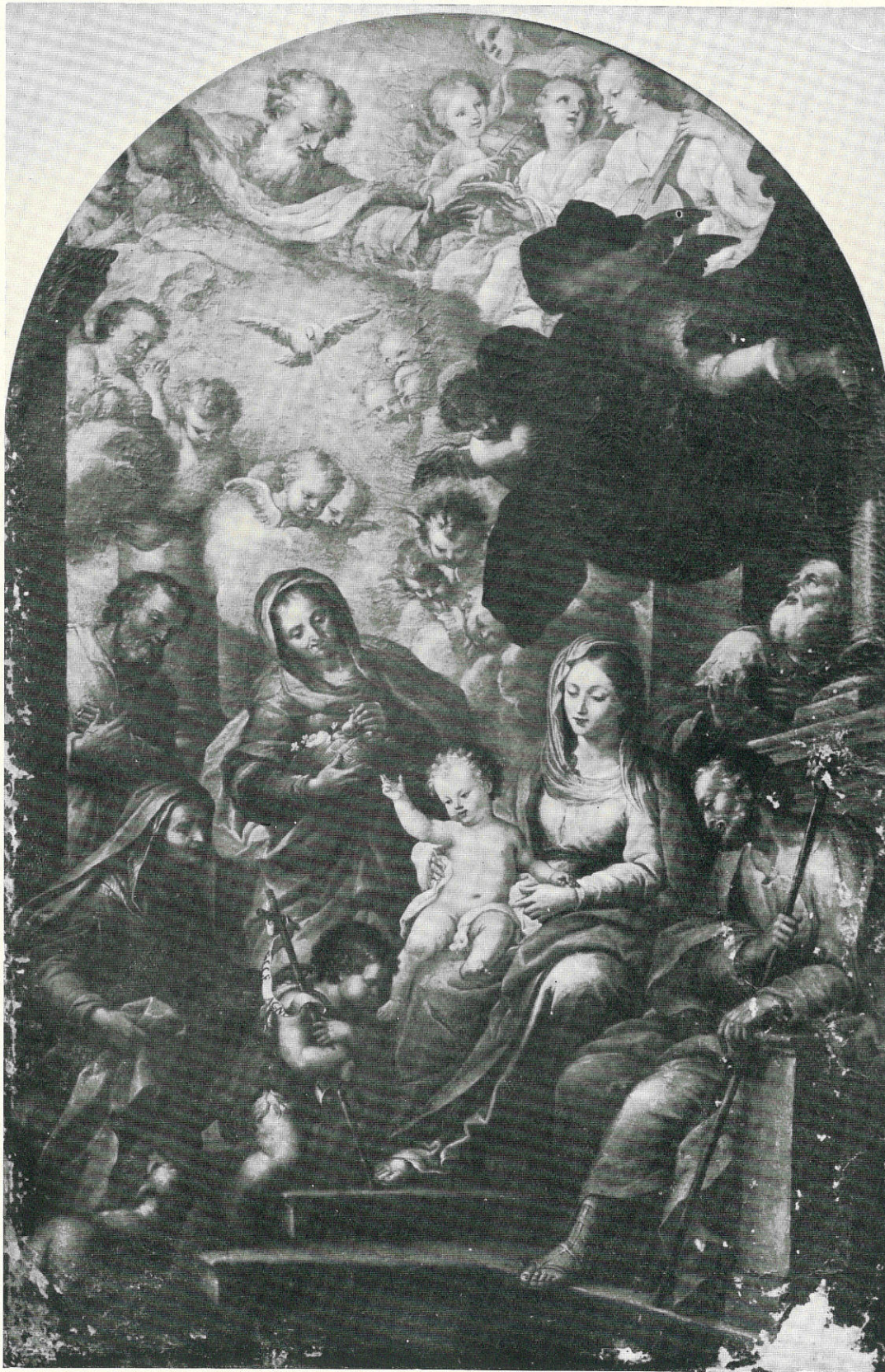
LA BRUNA DOMENICO · Sacra Famiglia · Sec. XVIII · Trapani, R. Museo.