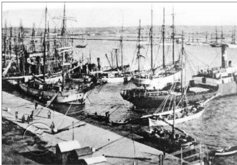
Trapani - Porto