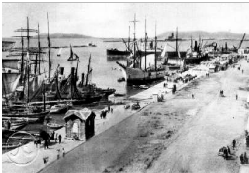
Trapani - Porto