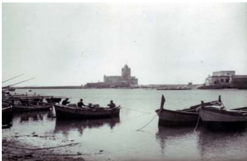
Barche di pescatori Trapanesi