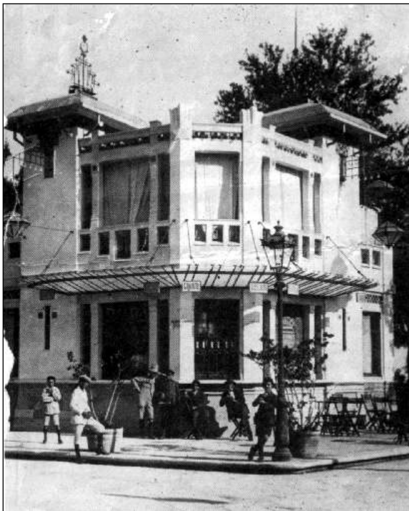
La Casina delle Palme