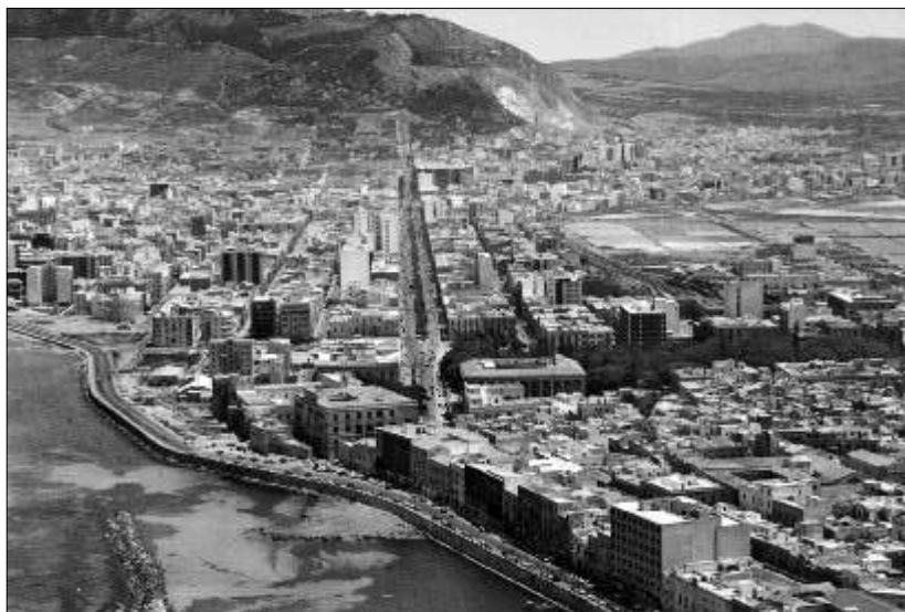
Fine anni '50 nella parte centrale della foto si notano le saline oggi occupate da Via Virgilio