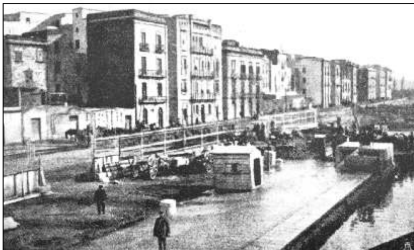
Viale Amm. Staiti all'inizio del secolo