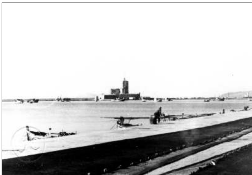
Trapani - Colombaia e Lazzarello