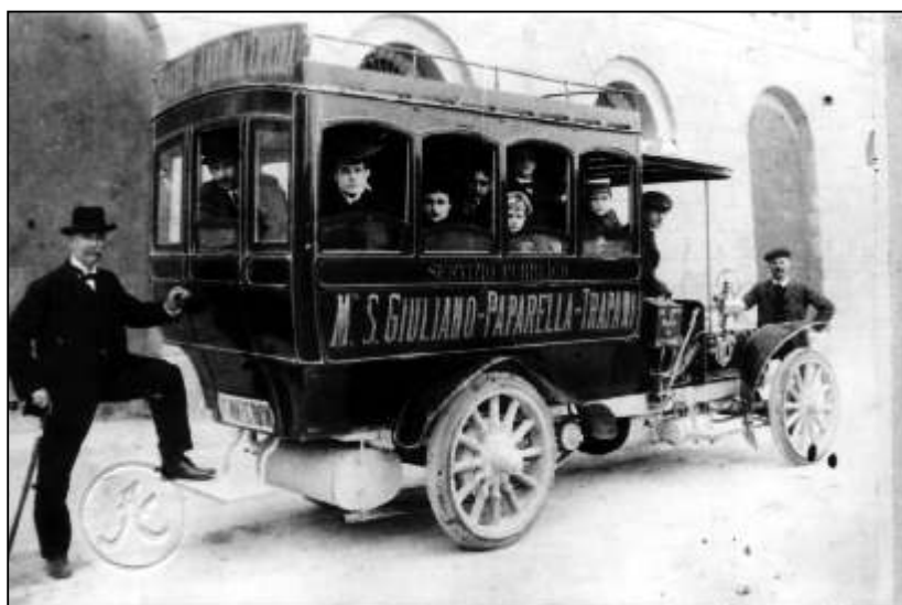
La prima corriera