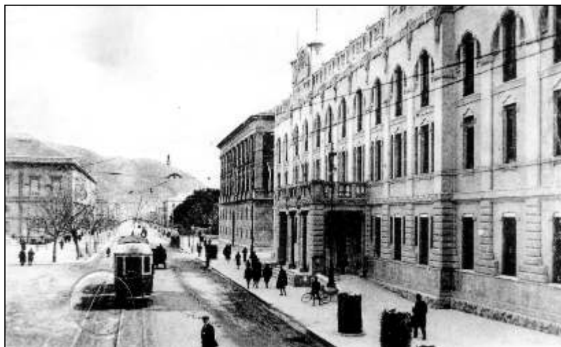
Palazzo delle Poste e Tram elettrico