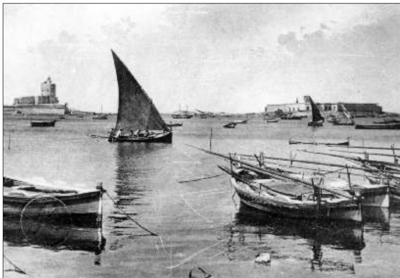
Trapani - Colombaia e Lazzarello