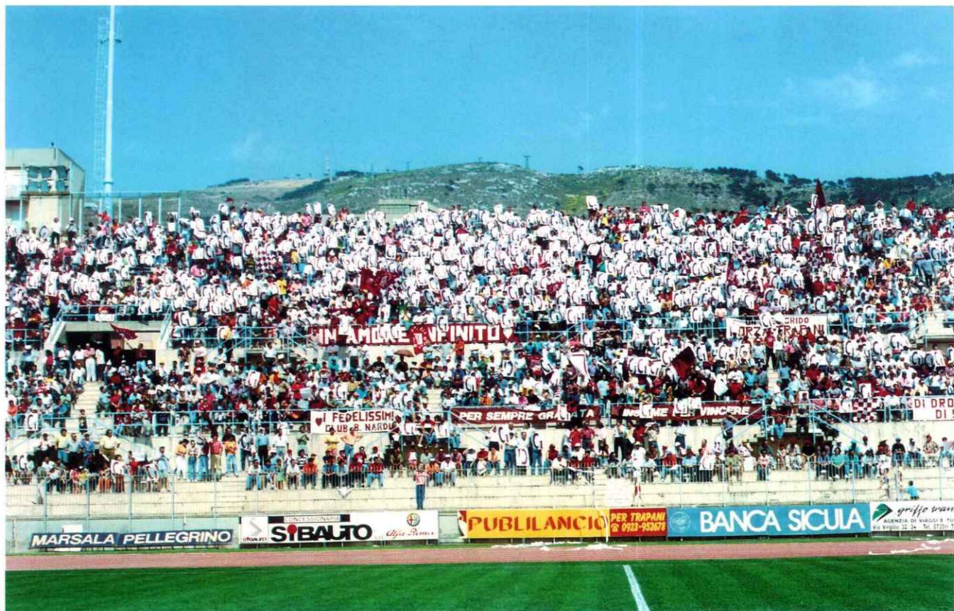
La tifoseria trapanese festeggia la promozione in C/1