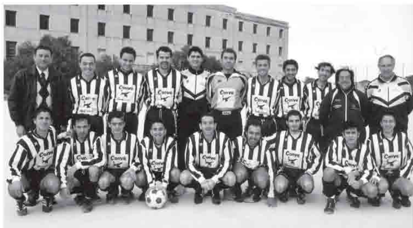
La Juvenilia in una formazione della stagione 2000-2001.