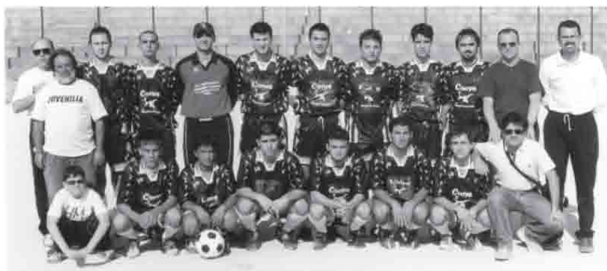
Stagione 2002-2003: la Juvenilia fa suo il titolo provinciale juniores .