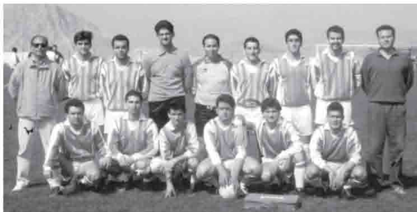
Una formazione della Juvenilia 1989-90.