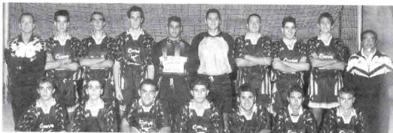
LA FORMAZIONE DELLA JUVENILIA CHE HA CONQUISTATO IL TITOLO JUNIORES