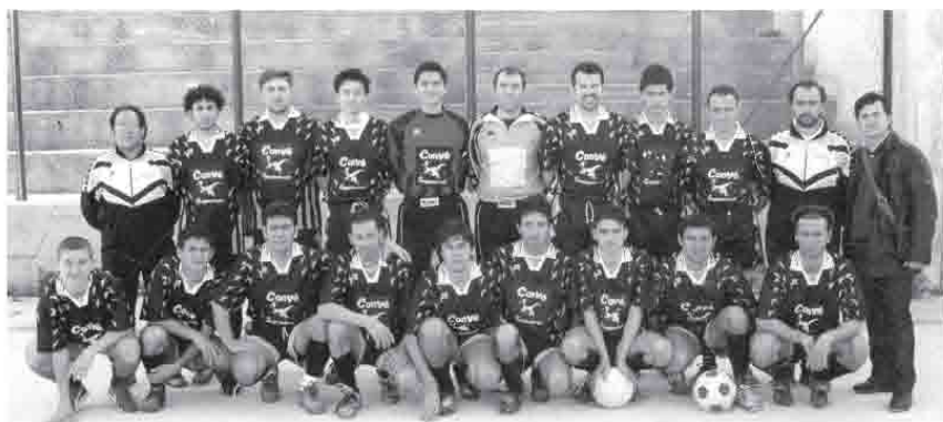
Una formazione della Juvenilia 2001-2002.