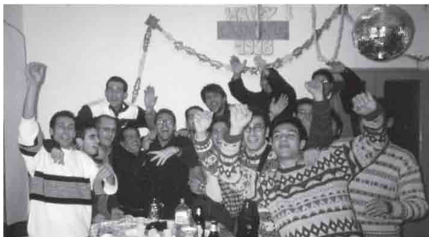
Si festeggia il Natale del 1998