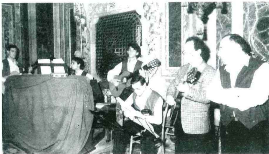
Due momenti del concerto tenuto dal complesso «Teatro e Vita» di Piacco nella chiesa della Badia Nuova