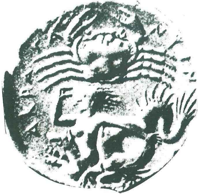
Tetradramma di Agrigento V secolo a.c.

La Sicilia è l'unica "Nazione" al mondo che ha una sua coniazione di monete, ininterrotta per 25 secoli.