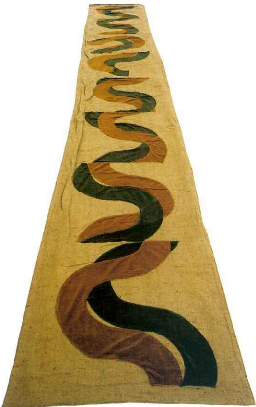
Carlo Ciussi Presenti 1990 tessuti misti cm 116x800