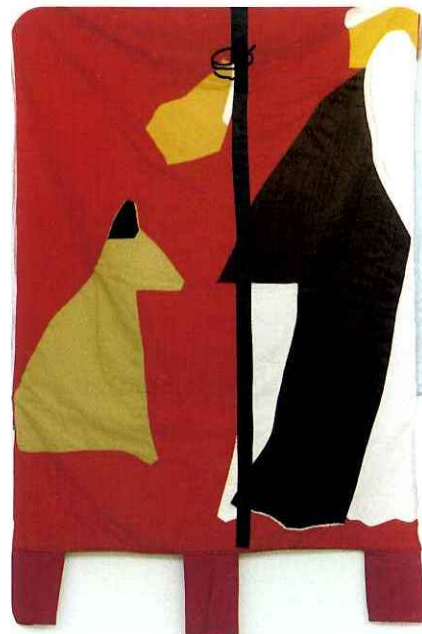
Giuseppe Santomaso Presenti 1988 tessuti misti cm 120x840