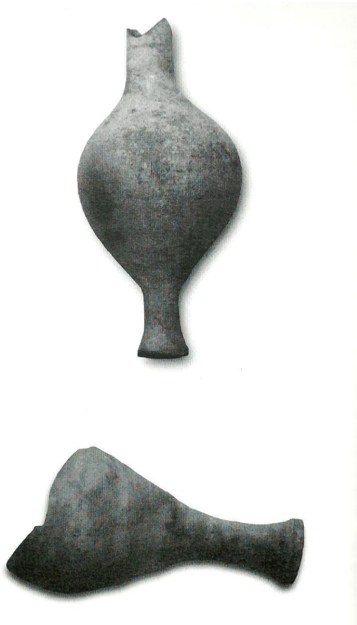
Unguentari di epoca romana rinvenuti nel sito dell'attuale Palazzo delle Poste ( da A. Filippi)