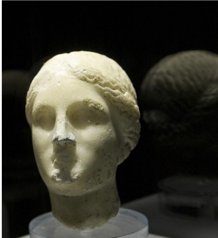
Testina di Venere Ericina di epoca ellenistica conservata presso il Museo A. Cordici