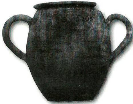
Bicchiere biansato di epoca romana ritrovato nel sito del Palazzo delle Poste (da A. Filippi)