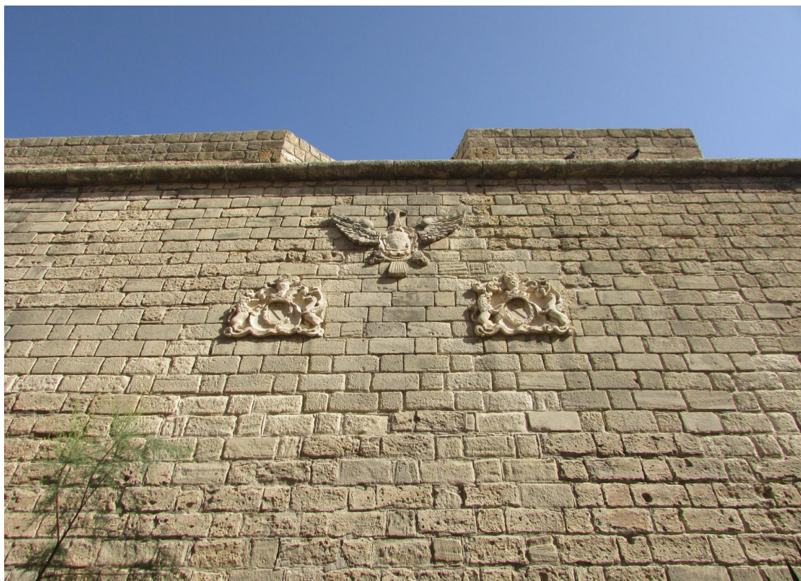
Le insegne del regno sul Bastione Imperiale (L.S.)