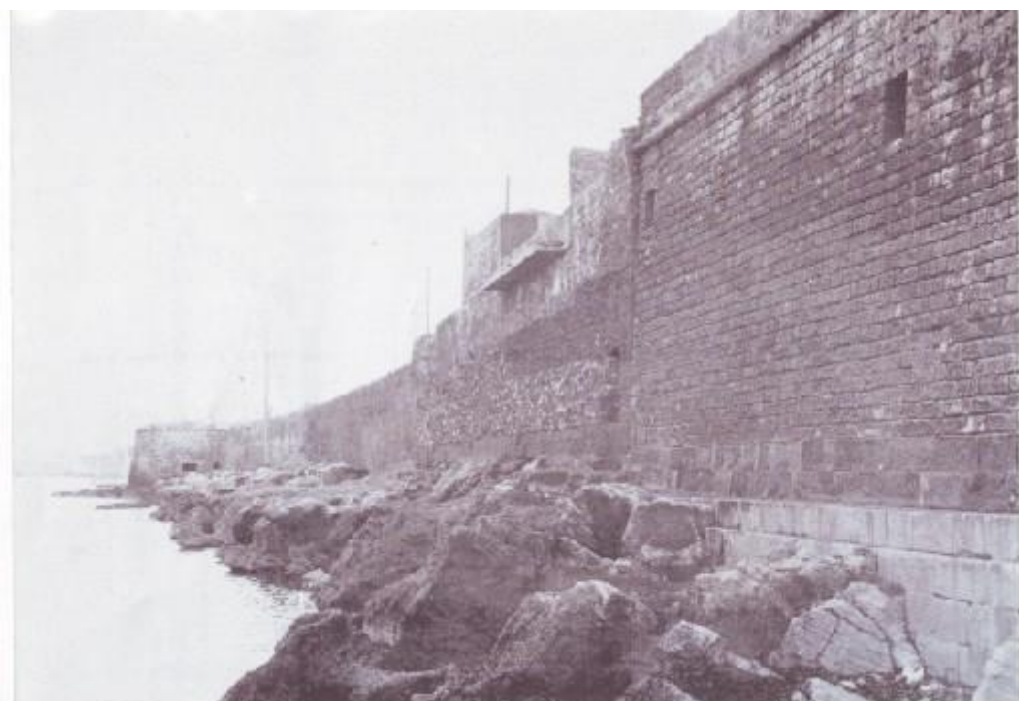
Bastione di Sant'Anna visto dalla parte del mare (da Giuseppe Romano)