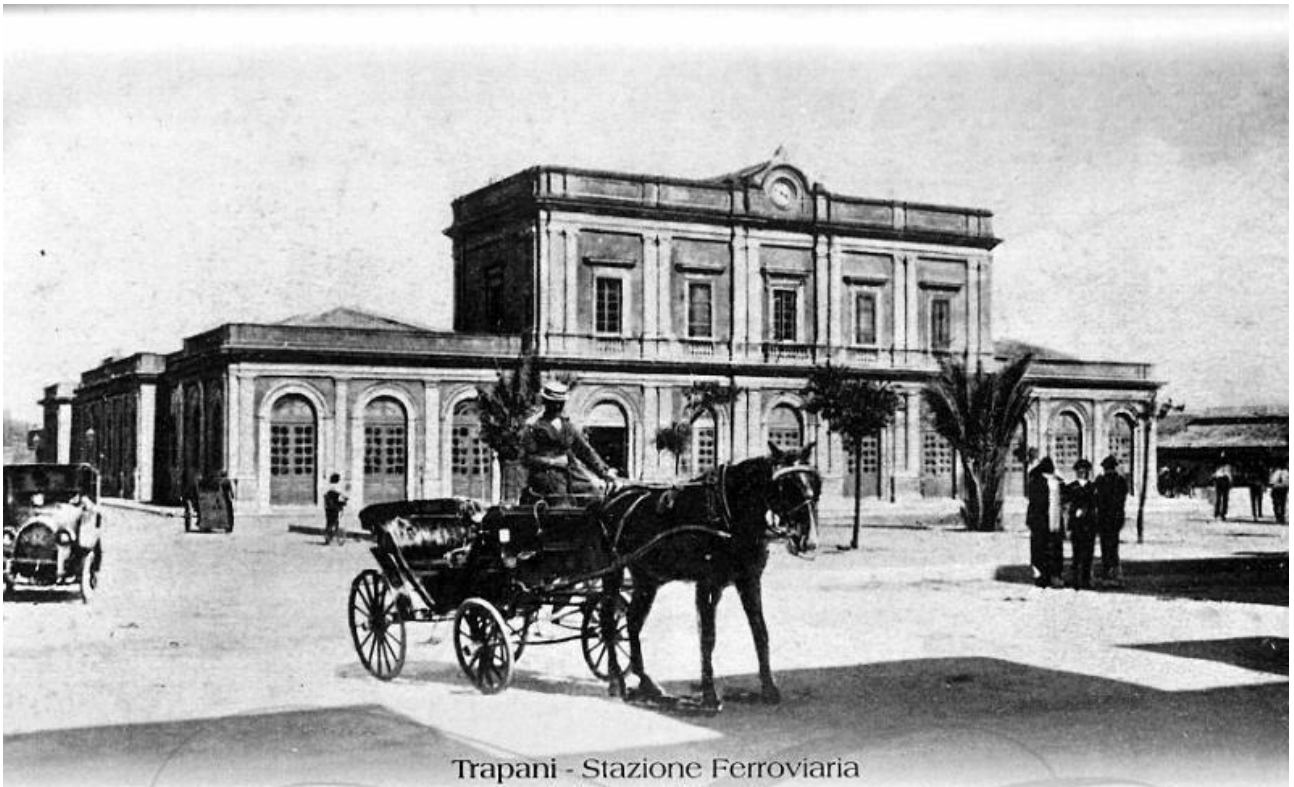
Trapani - Stazione Ferroviaria

La Stazione Ferroviaria venne inaugurata nel 1880 ed il tracciato iniziale fu realizzato colmando alcune saline che si trovavano nella zona posta a sud-est fuori città