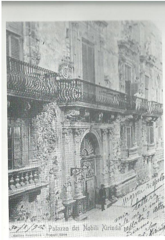
30/8/902 Palazzo dei Nobili Xirinda