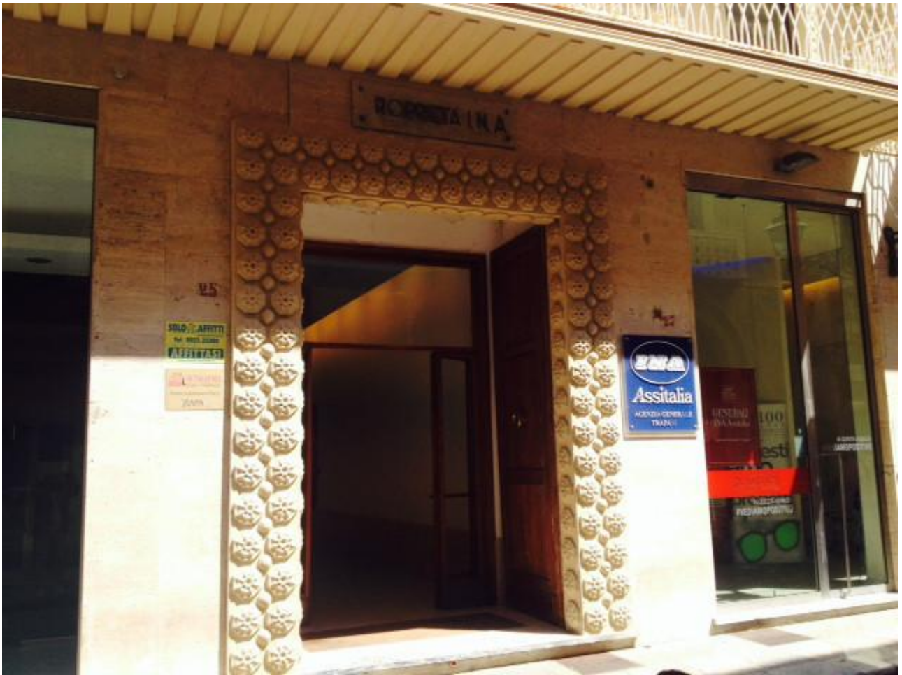
L'edificio attuale. La cornice del portale è l'unica parte recuperata ed incastonata nel nuovo palazzo. Ben poca cosa.