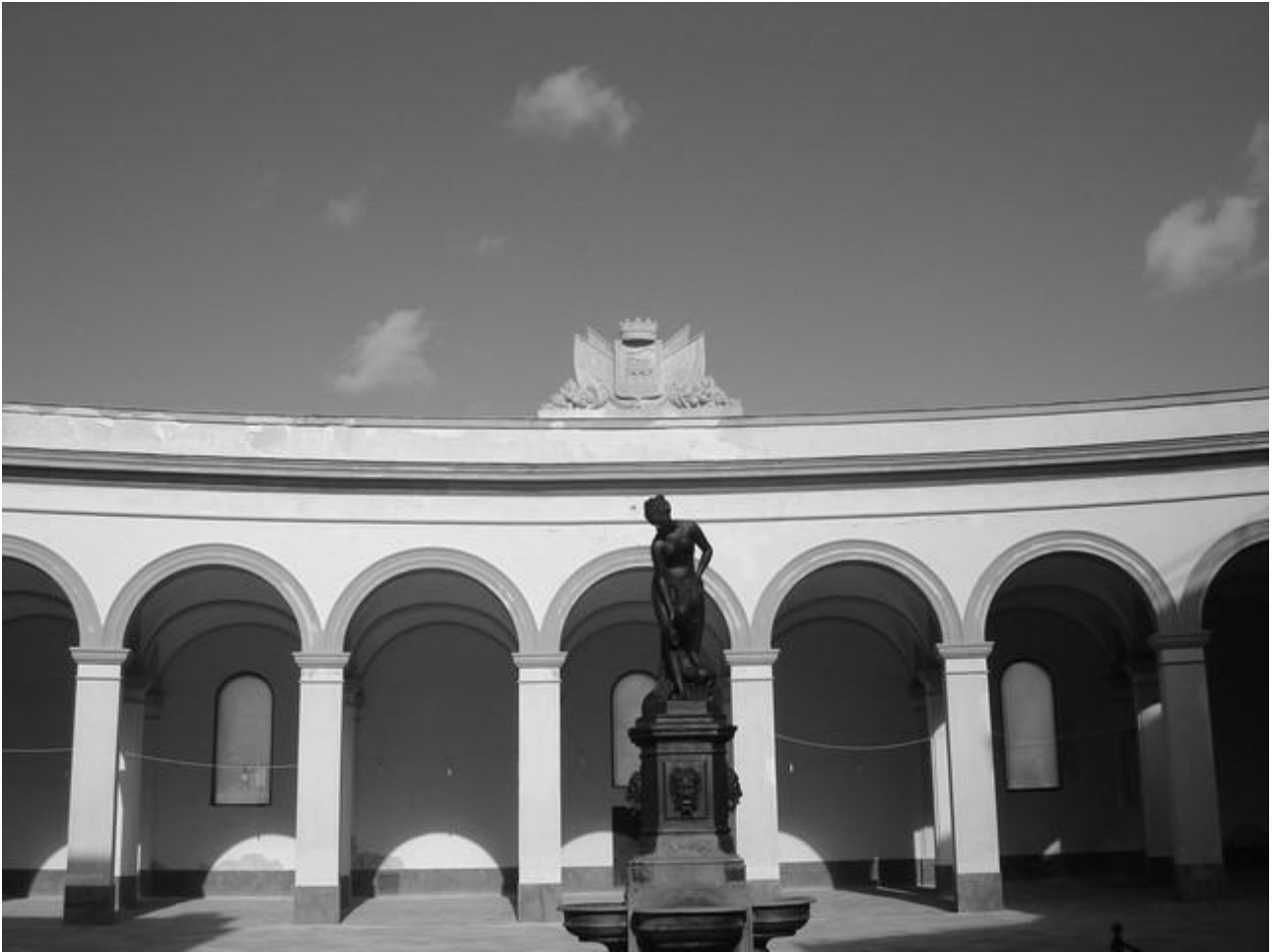
La piazza oggi, desolatamente vuota