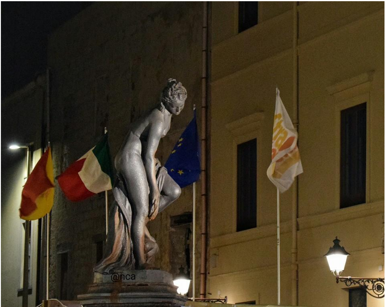
La Venere vista di profilo