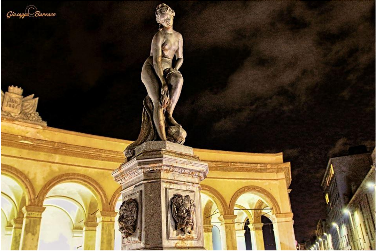
Notturmo in Piazza del Mercato del pesce