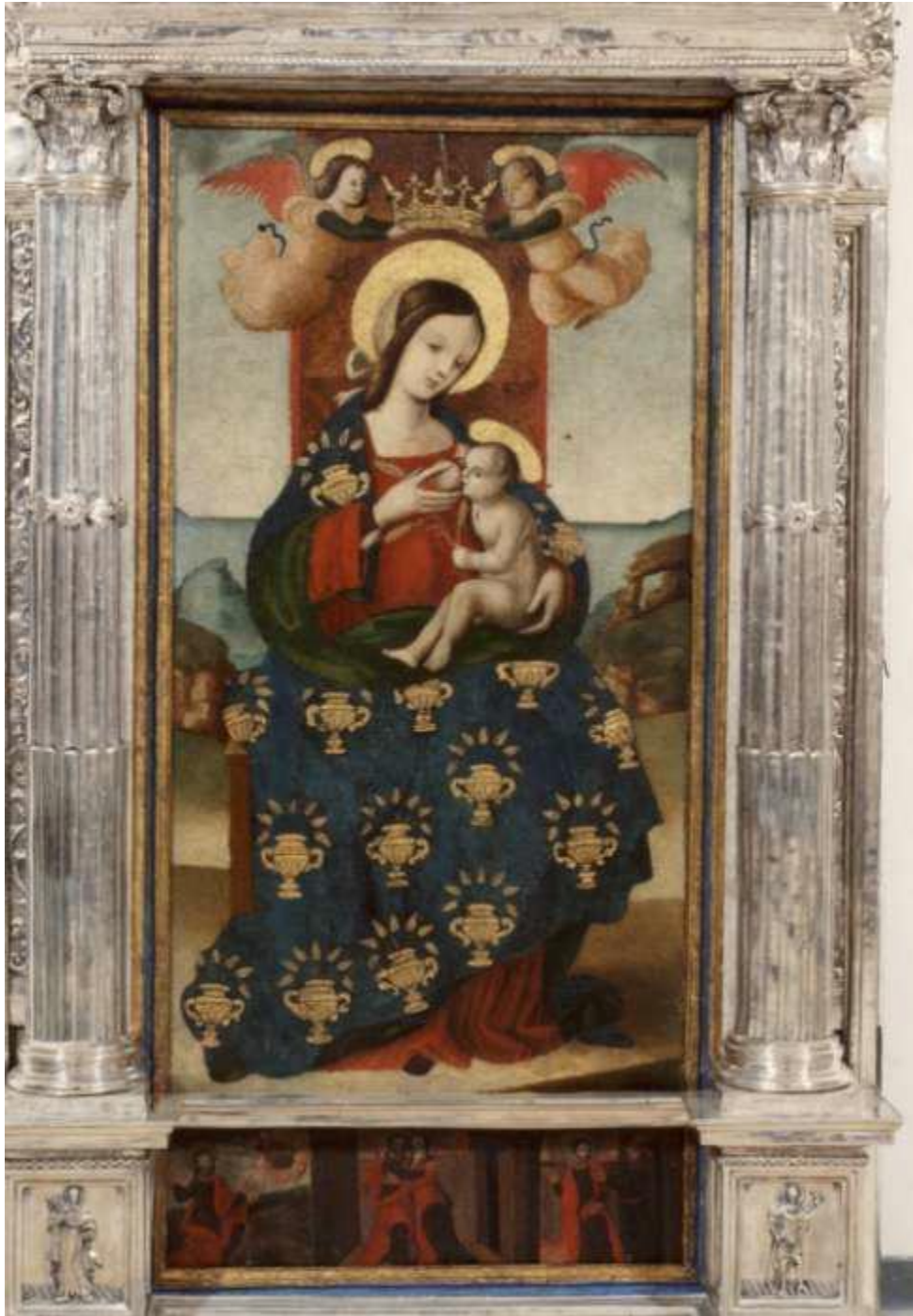
Quadro della Madonna di Custonaci nella cittadina omonima