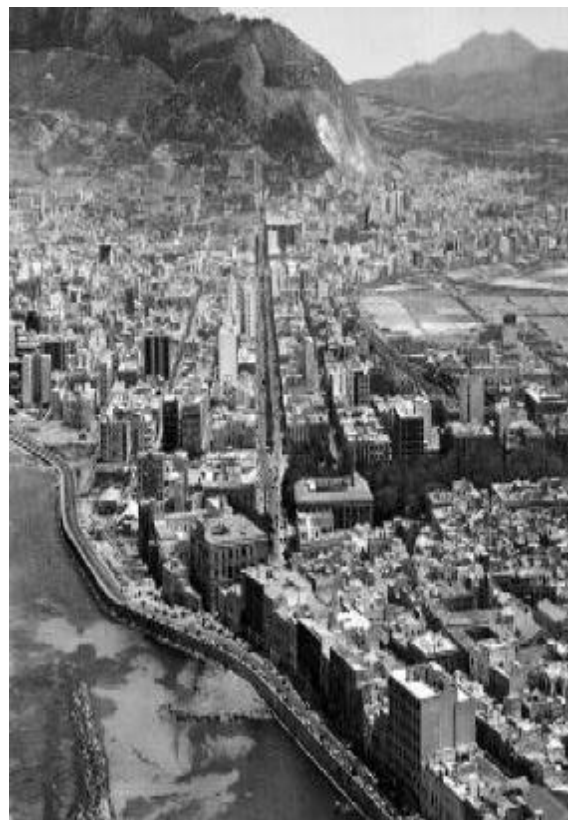
Curiosa immagine dal cielo (F. Giacalone)