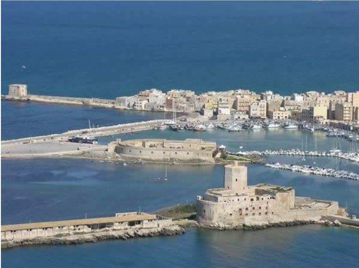
La Colombaia, il Lazzaretto, la Torre di Ligny ed il porticciolo Pescatori