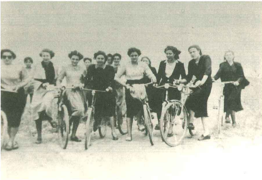
Bellezze «pacecote» in bicicletta (Paceco: primi anni Cinquanta)