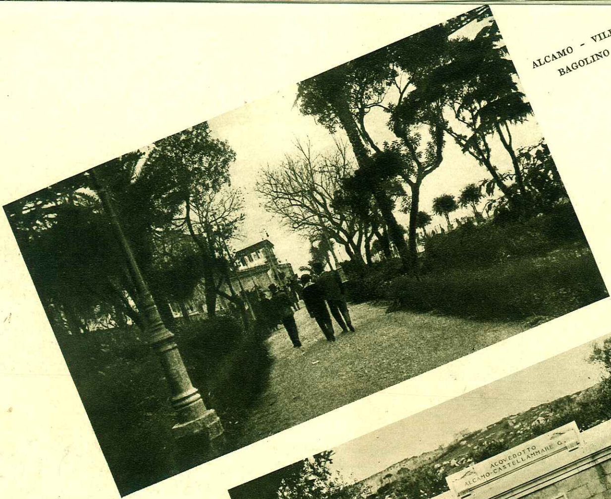
ALCAMO - VILLA BAGOLINO