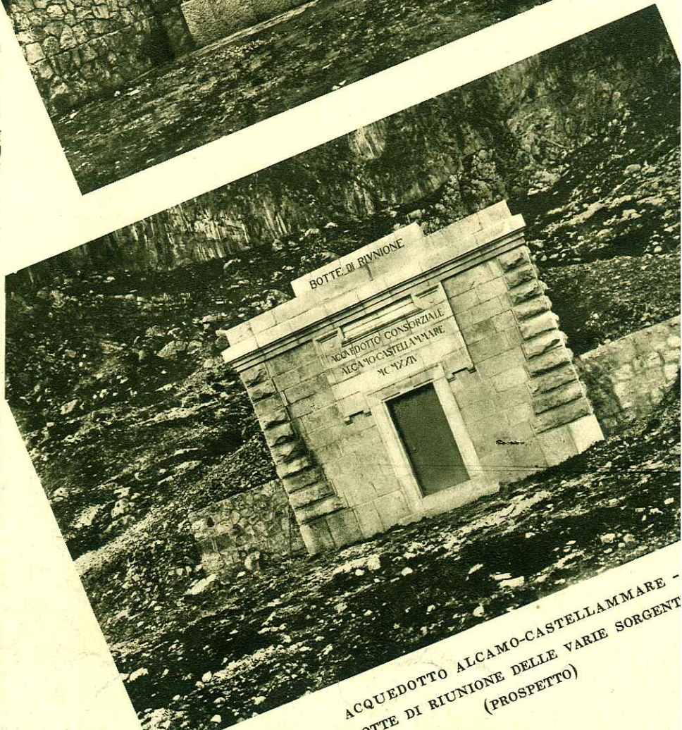
ACQUEDOTTO ALCAMO-CASTELLAMARE - BOTTE DI RIUNIONE DELLE VARIE SORGENTI (PROSPETTO)