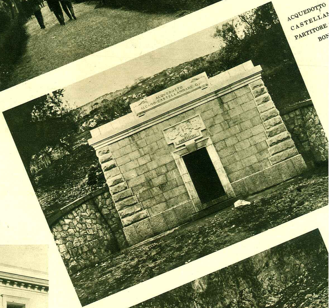
ACQUEDOTTO CASTELLAMARE PARTITORE BON