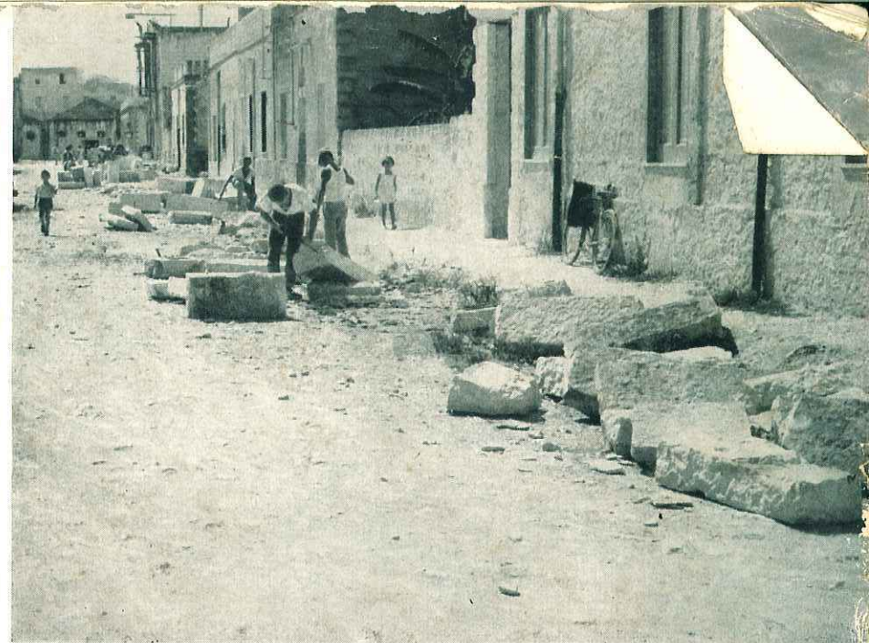
Fervore di opere in alcune strade cittadine