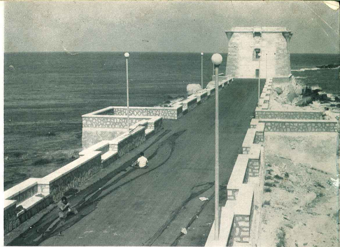
Viale Torre di Ligny, via Orti e Piazza XXI Aprile sono fra le strade recentemente bitu- mate e sistemate.