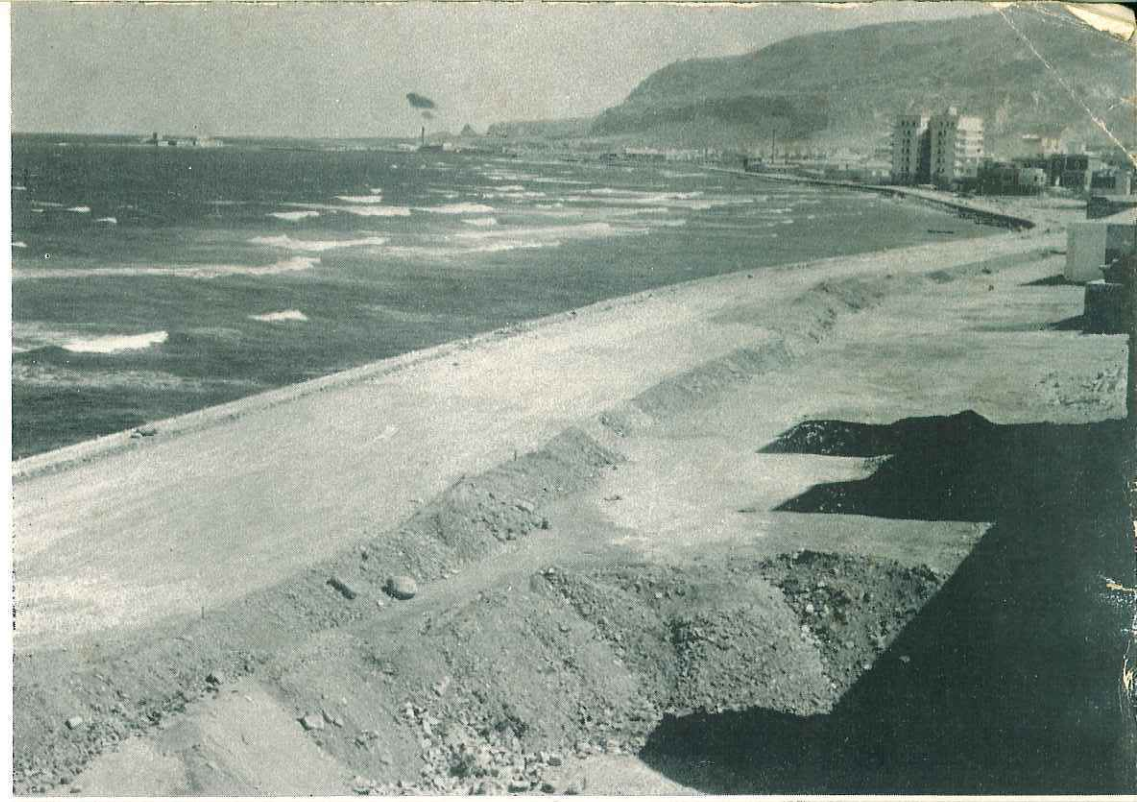
Da San Giuliano alla pesche- ria il primo lotto della lito- ranea nord in avanzata fase di costruzione