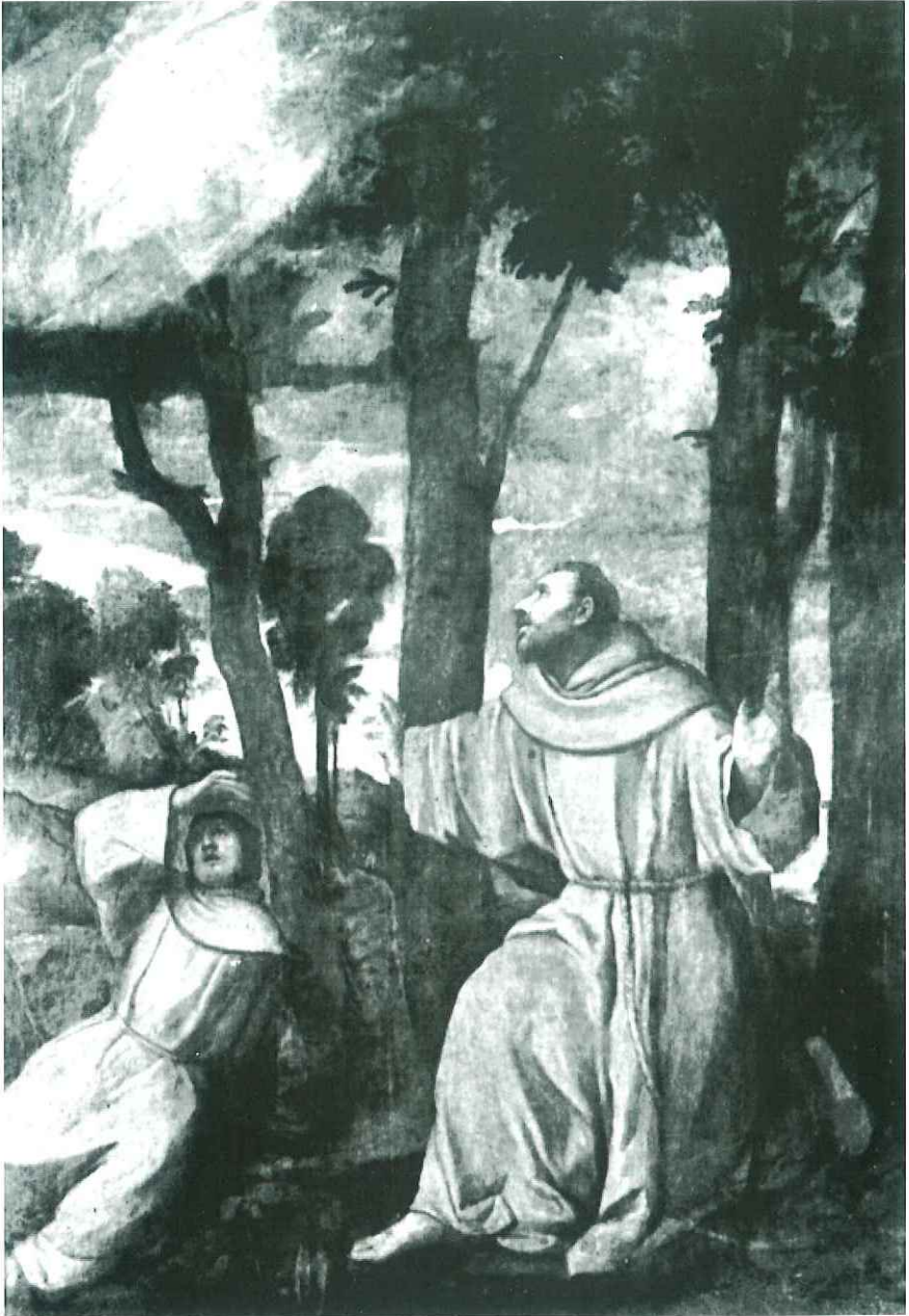
Titiziano Vecellio - S. Francesco riceve le stimmate (Museo Nazionale - Pepoli - Trapani, già in S. Francesco).