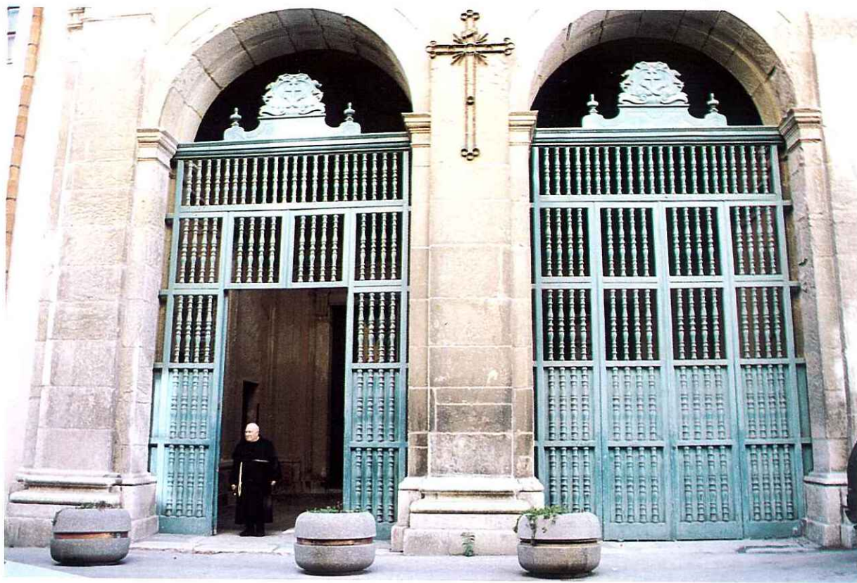
Fig. 1 - Portale d'ingresso della chiesa (P. Bonaventura Certo - 1638)