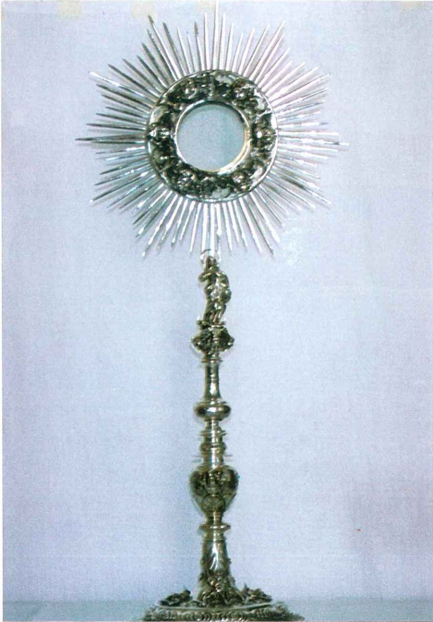
Fig. 9 - Ostensorio con statuetta dell'Immacolata che sostiene la raggi- ra (sec. XVII-XVIII)