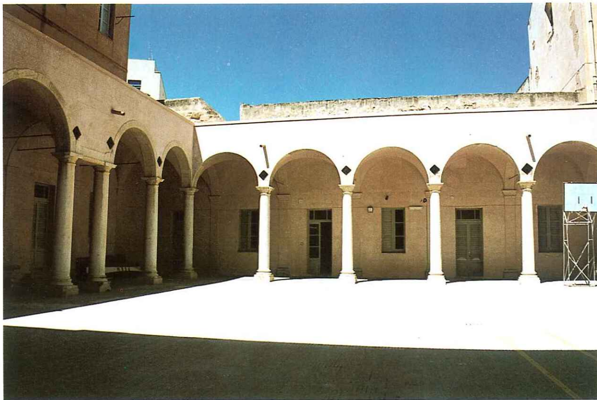
Fig. 3 - Chiostro dell'ex-convento (P. Bonaventura Certo - 1638)