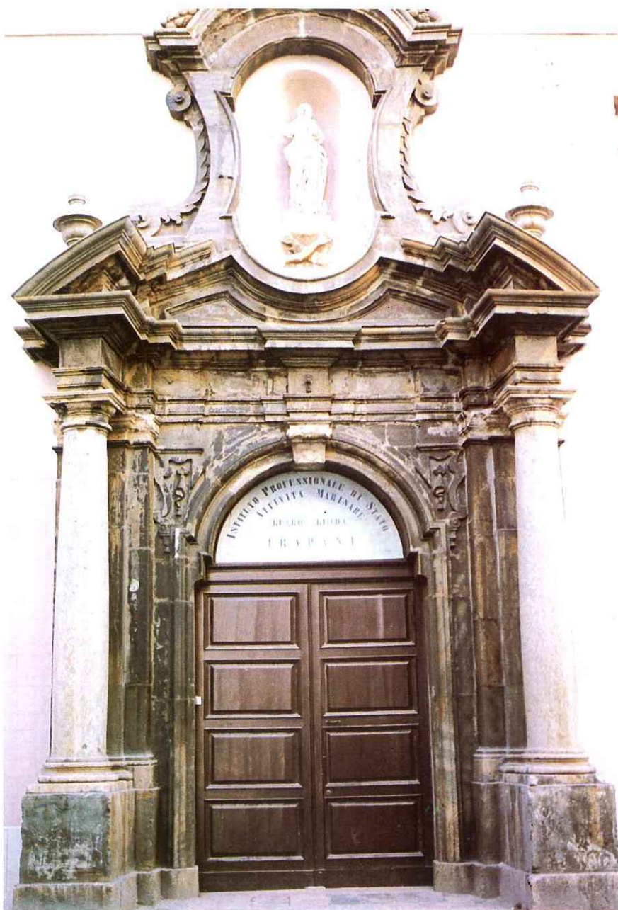
Fig. 2 - Portale d'ingresso dell'ex convento (Giovanni Biagio Amico - sec. XVIII)