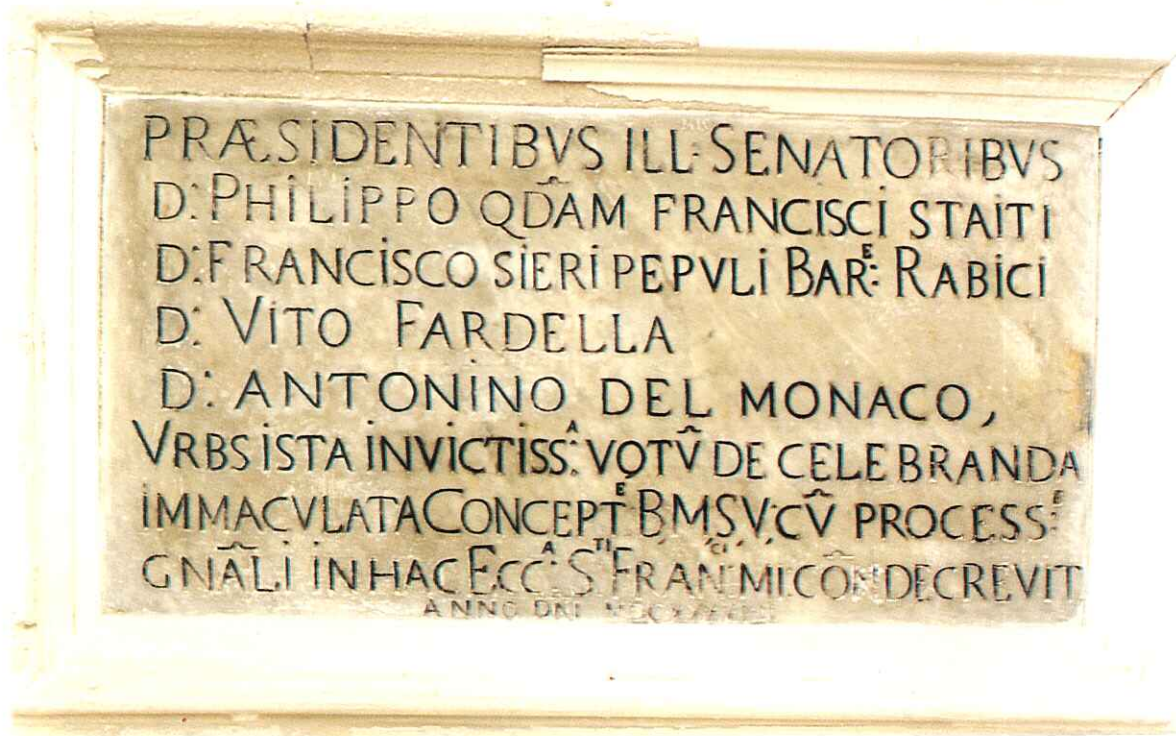
Fig. 8 - Lapide marmorea - Vi si ricorda che la solennità dell'Immacolata si doveva tenere nella Chiesa di S. Francesco (sec. XVII)