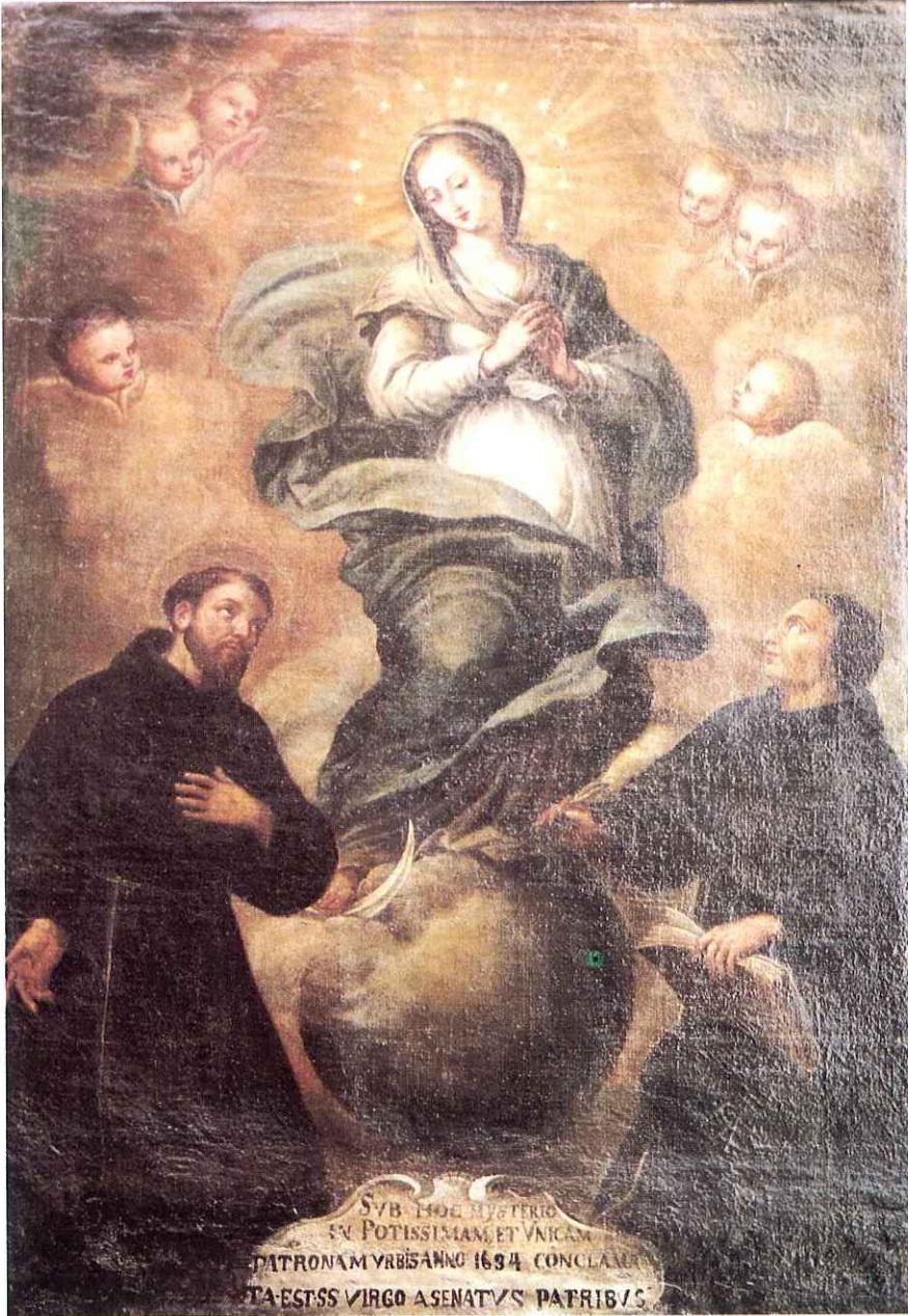
Fig. 5 - L'Immacolata tra S. Francesco e il B. Duns Scoto - (Tela - sec. XVII)