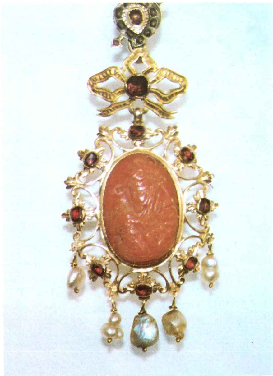
Fig. 7 - Cammeo - Corallo con figura dell'Immacolata ta S. Francesco e il B. Duns Scoto (sec. XVII)