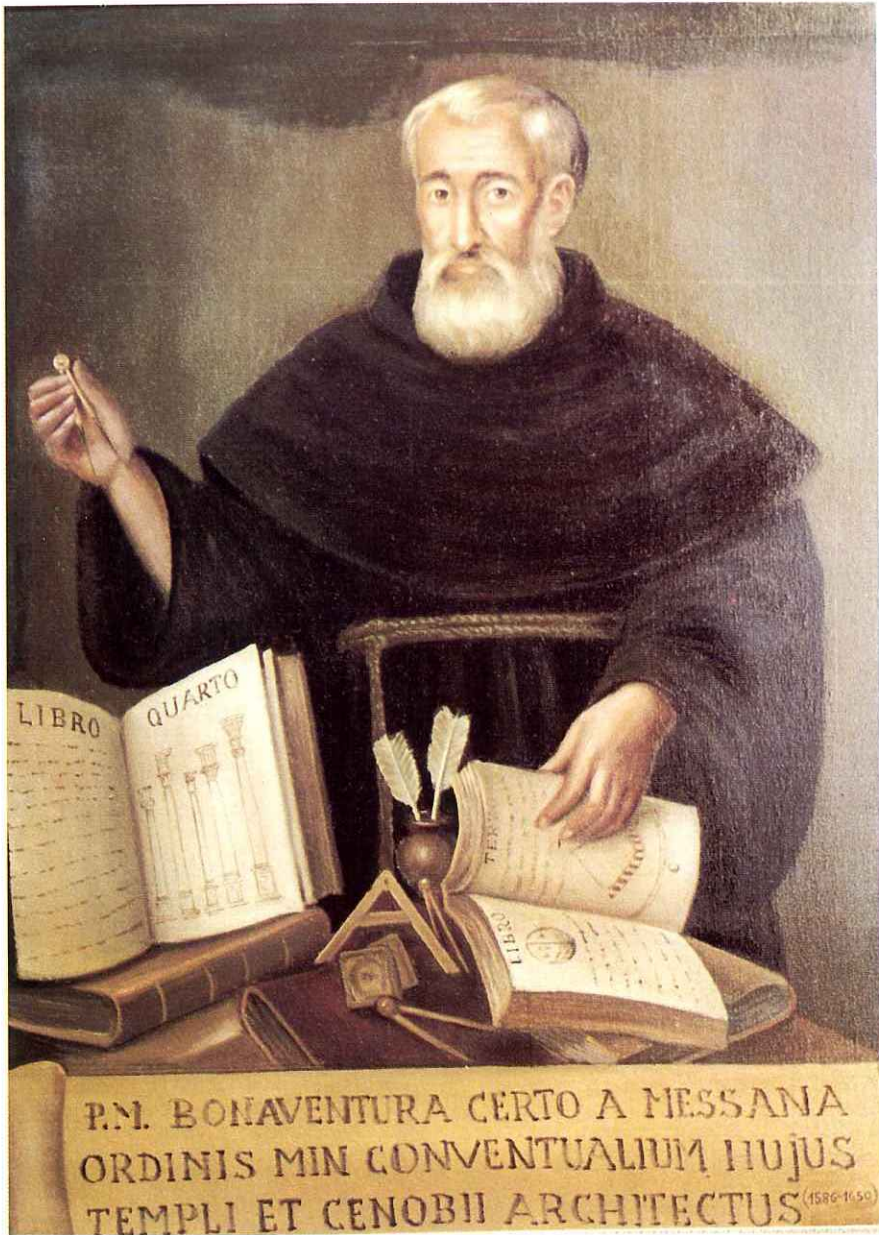
Fig.4 - P. Bonaventura Certo - Architetto della Chiesa di S. Francesco. (Copia dell'originale esistente nella Biblioteca Comunale di Palermo).