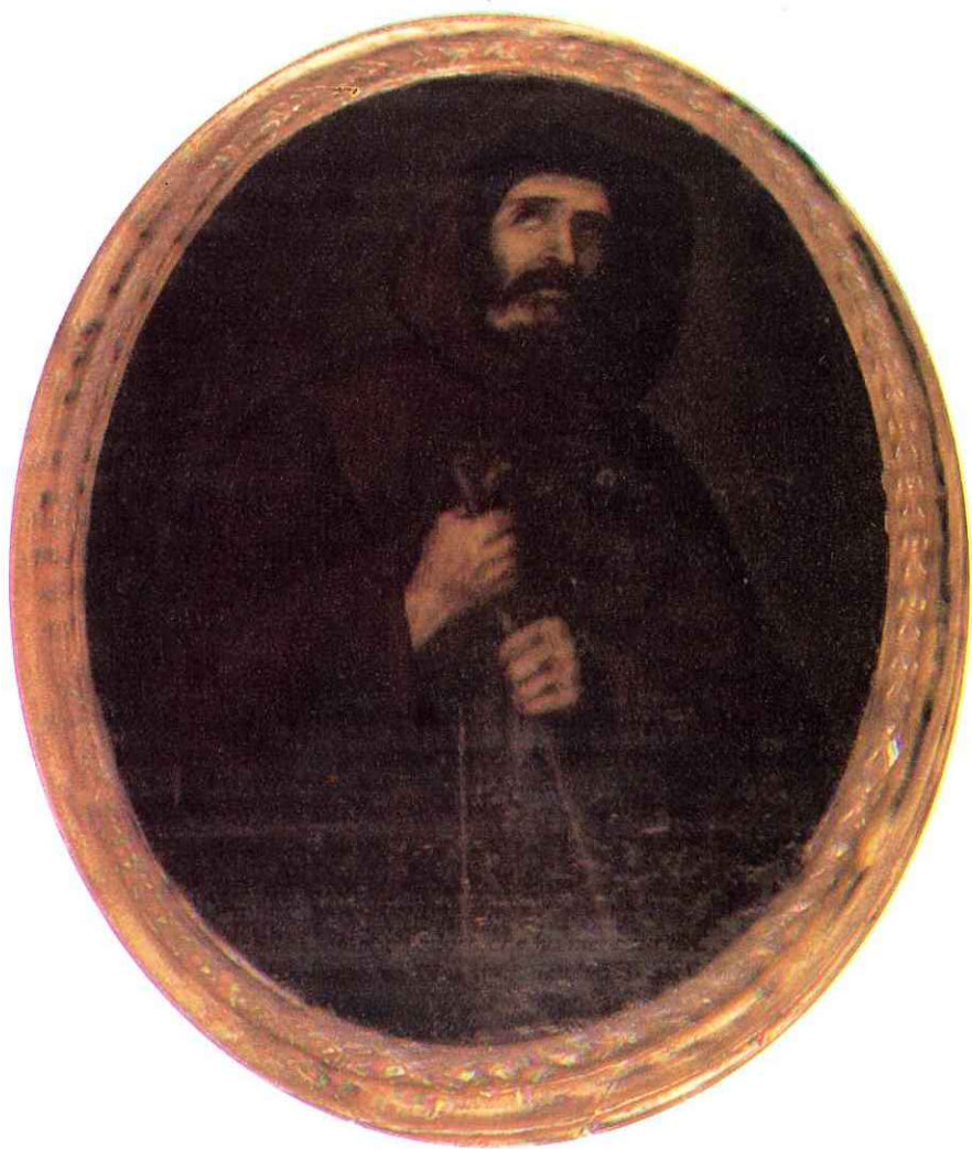
Fig. 10 - S. Francesco di Paola - (Tela - sec. XVII)