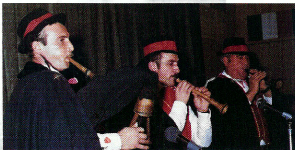
Il Gruppo Valle di Comino di Atina (FR).

Quest'anno la Rassegna non ha avuto carattere competitivo data la consumata bravura dei partecipanti