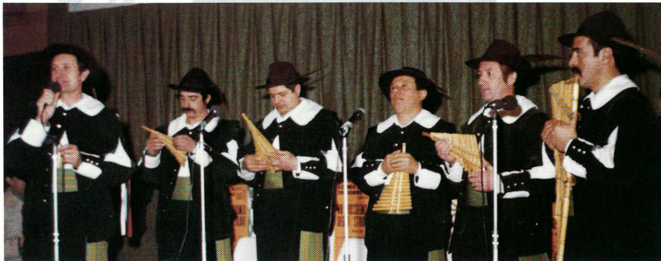
I "Bey" di Erba (CO) con i loro caratteristici "Firlinfeu".