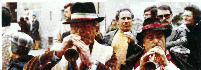
Il Gruppo Val di Comino di Atina (FR).