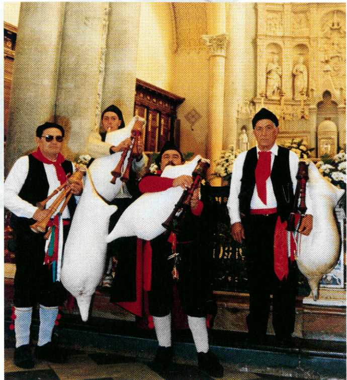
Concerto all'interno della Chiesa Madre.