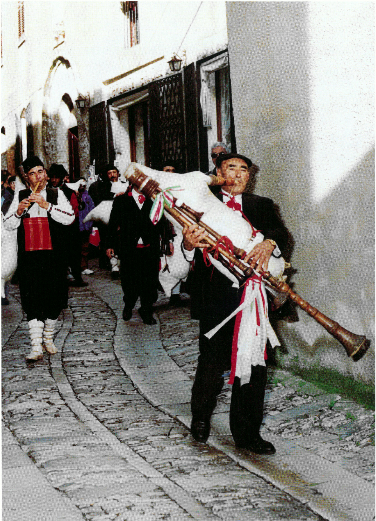
Il corteo degli strumenti popolari lungo le caratteristiche stradine di Erice.