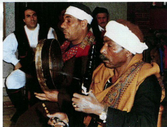
Gli Egiziani vincitori della Zampogna d'Oro.