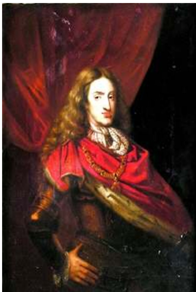
Carlo II d'Asburgo di Spagna