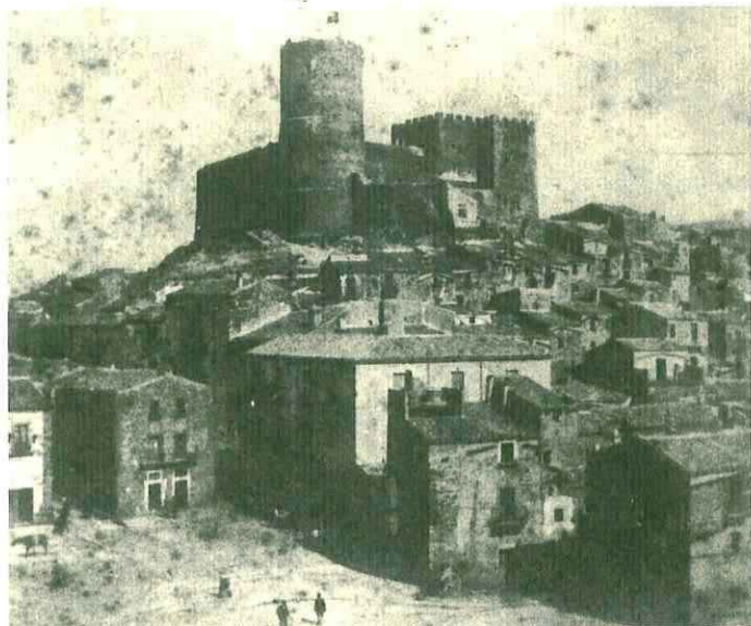
Largo S. Francesco e Castello Normanno