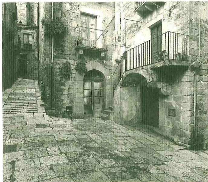
Angolo via Cascio Cortese e via Gaspare Favara