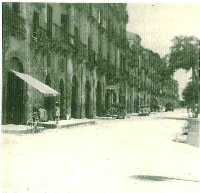
Via Simone Corleo (1901), oggi via Matteotti