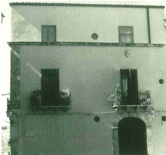
Casa di Simone Corleo