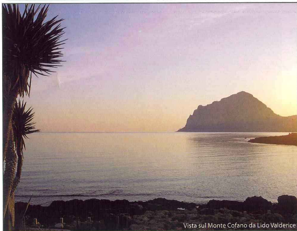
Vista sul Monte Cofano da Lido Valderice