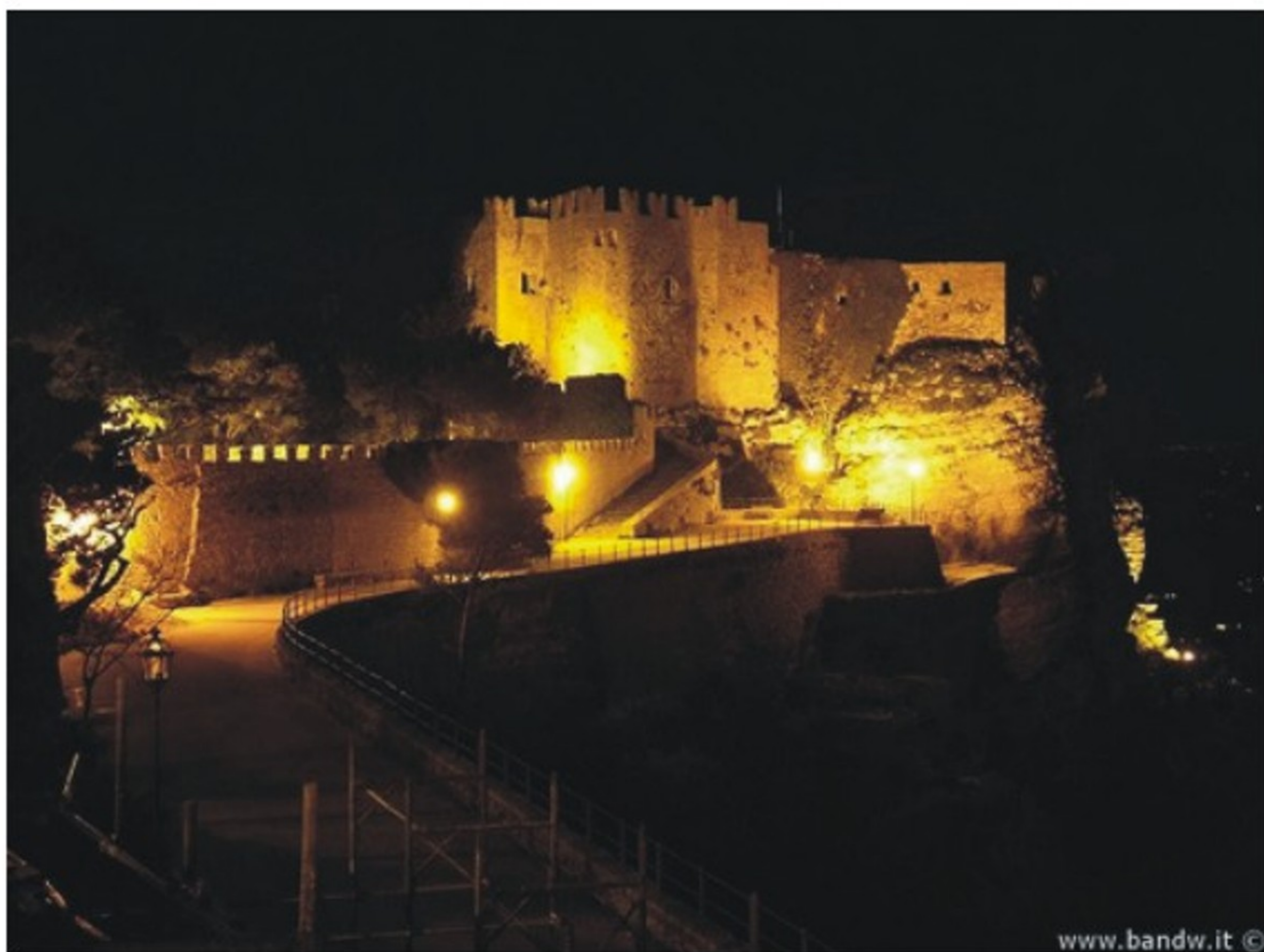
Veduta del Castello di Venere di notte