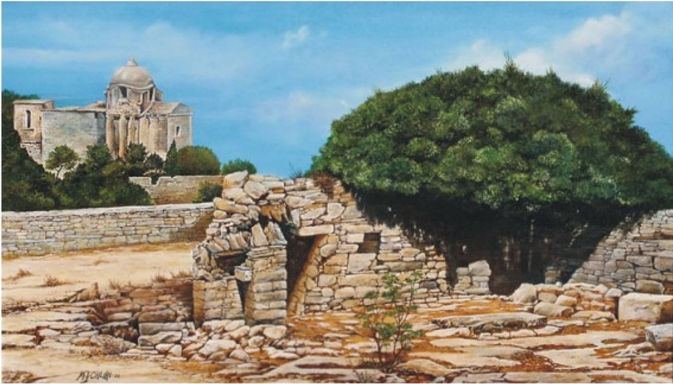
(sopra) Ritratto del sito archeologico presente all'interno del Castello di Venere