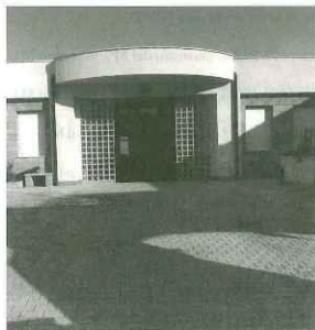
Prospetto del Centro Diurno per Anziani "V. Ippolito", in Corso dei Mille, 163.