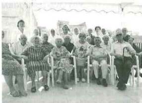
Foto di gruppo di anziani e del personale operativo della Casa di Ospitalità "Mangione".