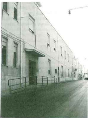
Prospetto della Casa di Ospitalità "Mangione", in Via Florio, 44.