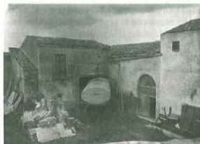
Fabbricato di V. Ippolito, prima della trasformazione nell'attuale Centro Diurno per Anziani.