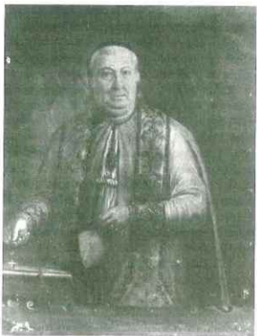
D. Benedetto Mangione (tela, nel Museo d'arte sacra di Alcamo).