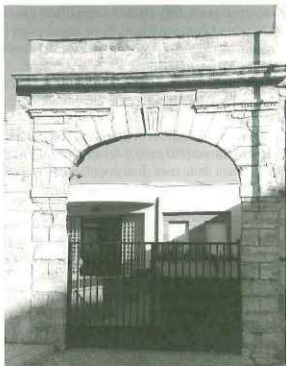
Portale dell'ex fabbricato di V. Ippolito, prima della ristrutturazione a Centro Diurno per Anziani.