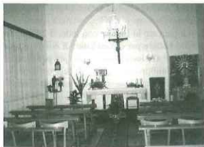
Cappella della Casa di Ospitalità "Mangione".