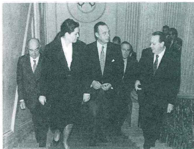
Nell'interno un ampio servizio fotografico delle giornate trapanesi dei Principi Sabaudi

Nella foto un momento della loro visita al Comune di Trapani.