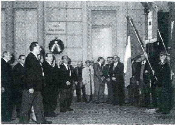
Nel primo pomeriggio di Sabato 29 novembre Autorità, ex Combattenti, Associazioni di Arma rendono omaggio ad Amedeo di Savoia Aosta, Eroe dell'Amba Alagi. Viene deposta una Corona di alloro sulla Targa che ricorda il Principe Sabauda.