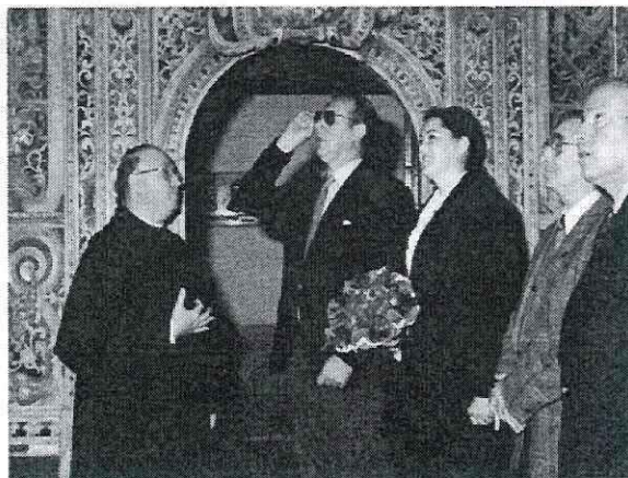
Silvia ed Amedeo di Savoia visitano la Basilica dell'Annunziata e rendono omaggio alla Madonna di Trapani.