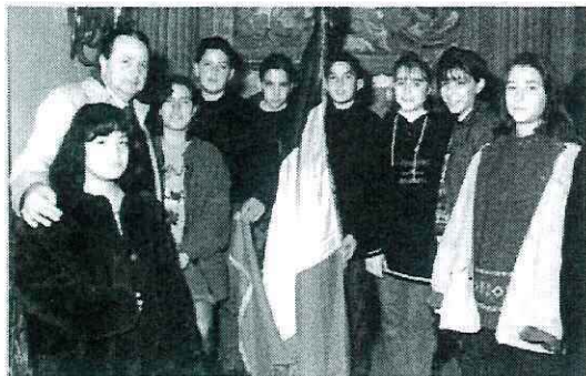
Gli alunni di una Scuola media cittadina ricevono il Tricolore. L'incontro avviene alla Camera di Commercio.