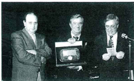
Un incontro con la nostalgia. Durante una serata organizzata da un Gruppo Jazz di Trapani si festeggia il M.o. Lelio Luttazzi per la sua lunga attività artistica. Gli viene offerta una Targa ricordo.