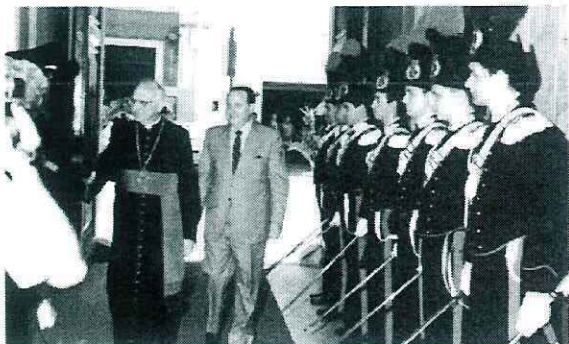
Festeggiamenti per la Giornata dell'Arma dei Carabinieri. La cerimonia si svolge presso la Sede in Via Orlandini.