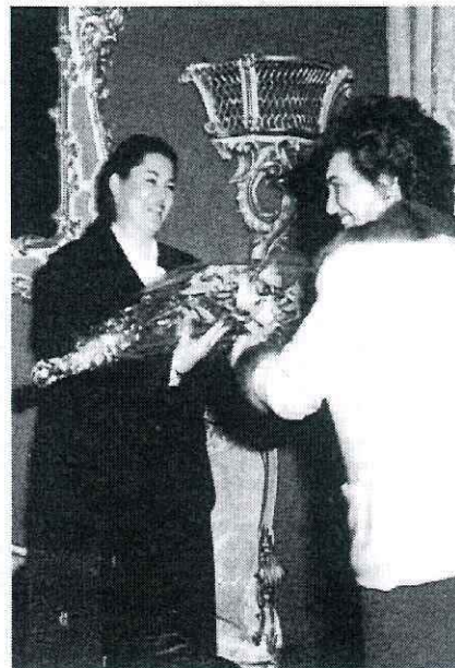
Un omaggio floreale alla Duchessa Silvia di Savoia offerto a nome del Personale del Comune

Un commosso lunghissimo applauso ha chiuso la Manifestazione. Alla fine i Duchi sono rimasti «prigionieri» dei trapanesi che si sono stretti attorno a loro con amicizia ed entusiasmo.