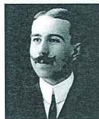
TITO MARRONE (Trapani 1882 - Roma 1967)

COMUNE DI TRAPANI E ASSOCIAZIONE POETICA DREPANUM