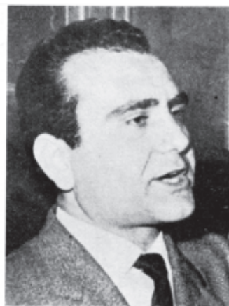
On. Ludovico Corrao eletto Senatore per il P.S.I.U.P. e P.C.I.