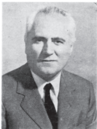
On. Michele Cifarelli eletto Senatore per il P.R.I.