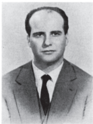
On. Aristide Gunnella eletto Deputato nella lista n. 4 (P.R.I.)