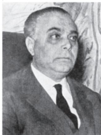
On. Bernardo Mattarella rieletto Deputato nella lista n. 2 (D.C.)