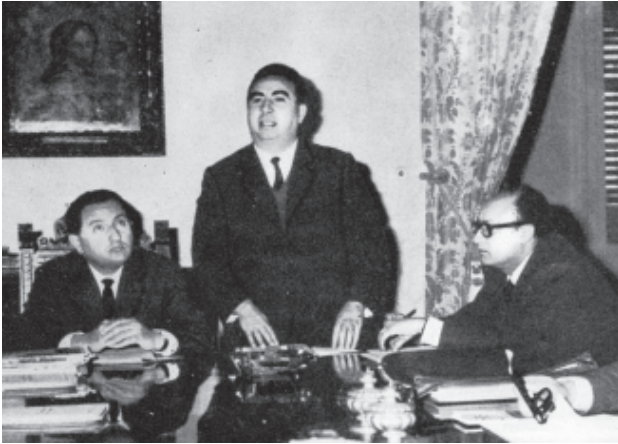
L'Assessore Salvatore Giurlanda, Commissario Azienda Turismo