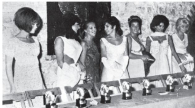
Attrici in attesa di ricevere la "Venere d'argento". Da sinistra: Cristina Gaioni, Gabriella Giorgielli, Luciana d'Arad, Rossella Como, Marisa Merlini, Gloria Paul, Margareth Rose