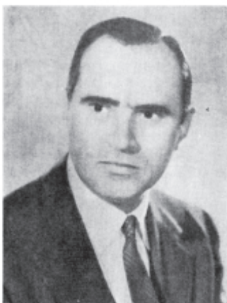
On. Benedetto Cottone rieletto Deputato nella lista n. 5 (P.L.I.)