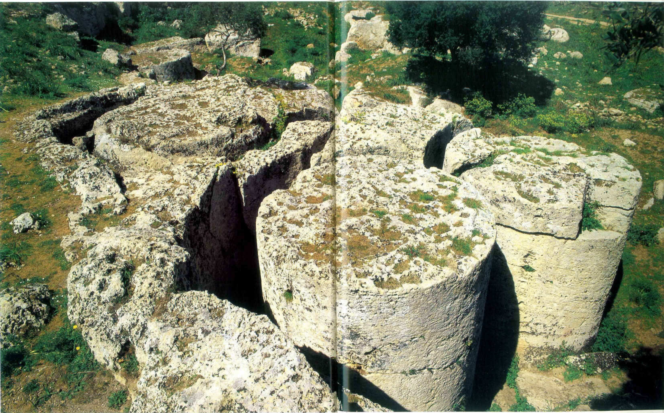
Tav. LVII - Campobello di Mazara. Cave di Cusa.