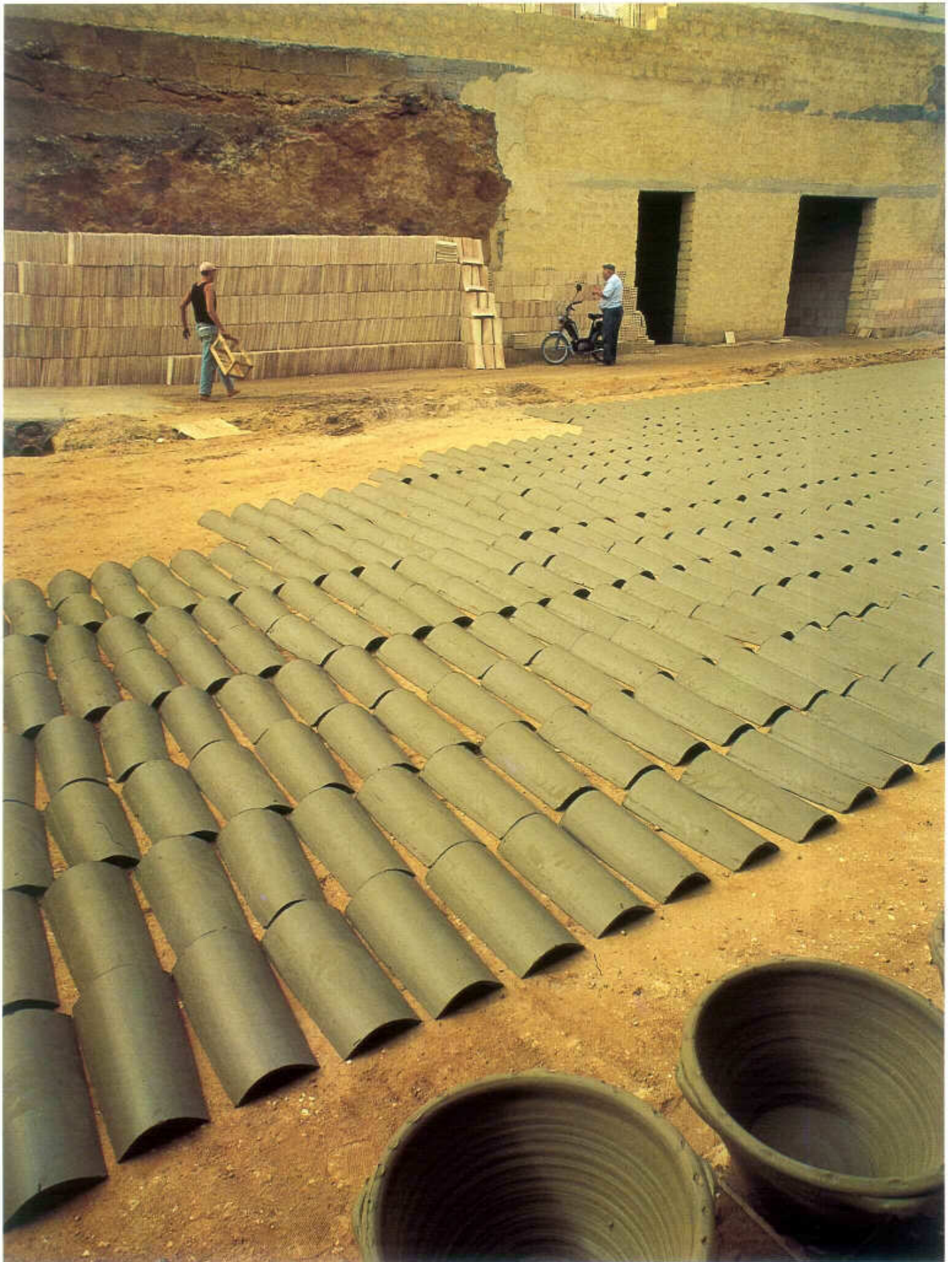
Tav. LIII - Mazara del Vallo, "Stazzuni",