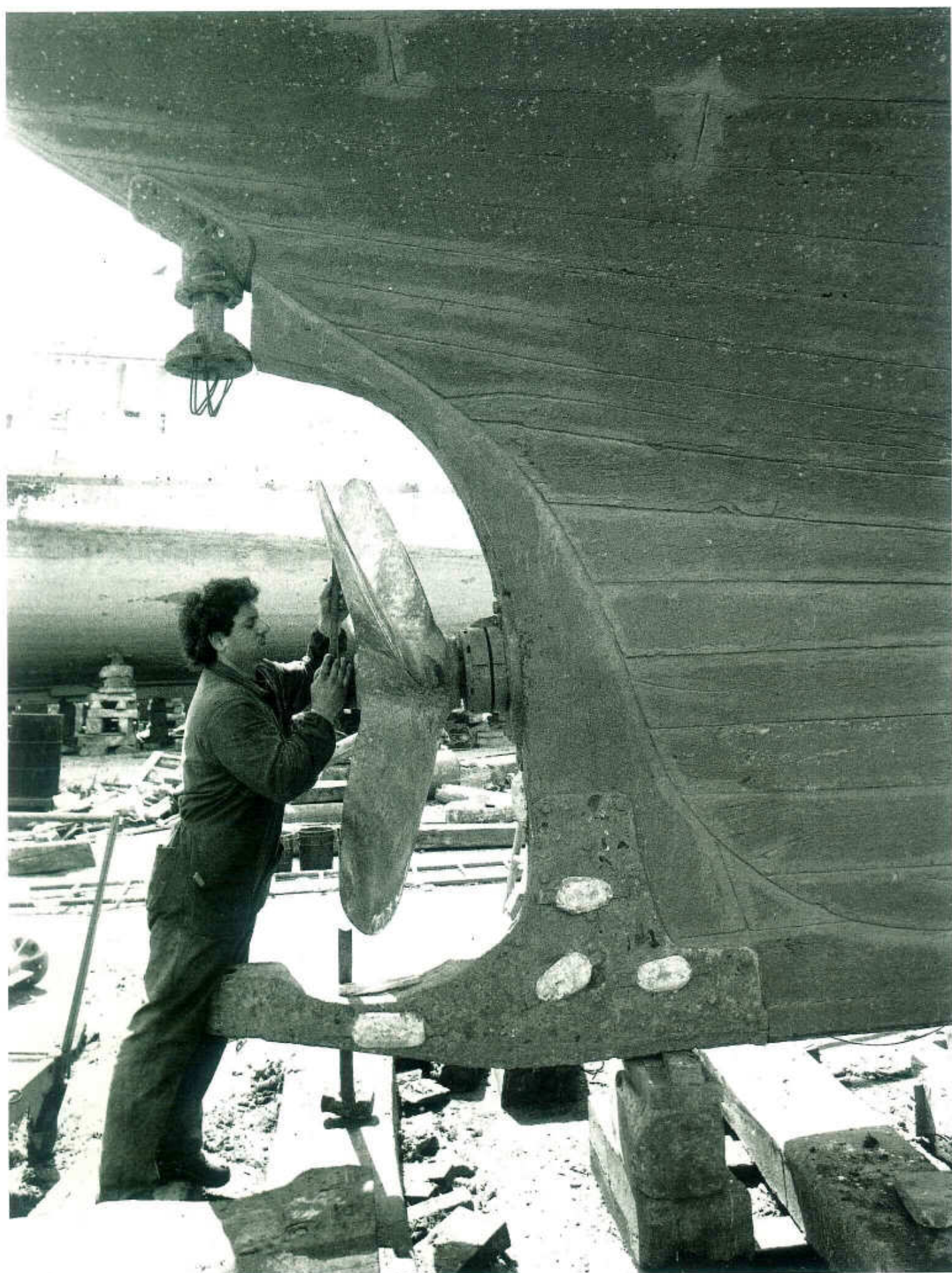
Tav. XLVIII - Mazara del Vallo. Lavoro nei cantieri navali.