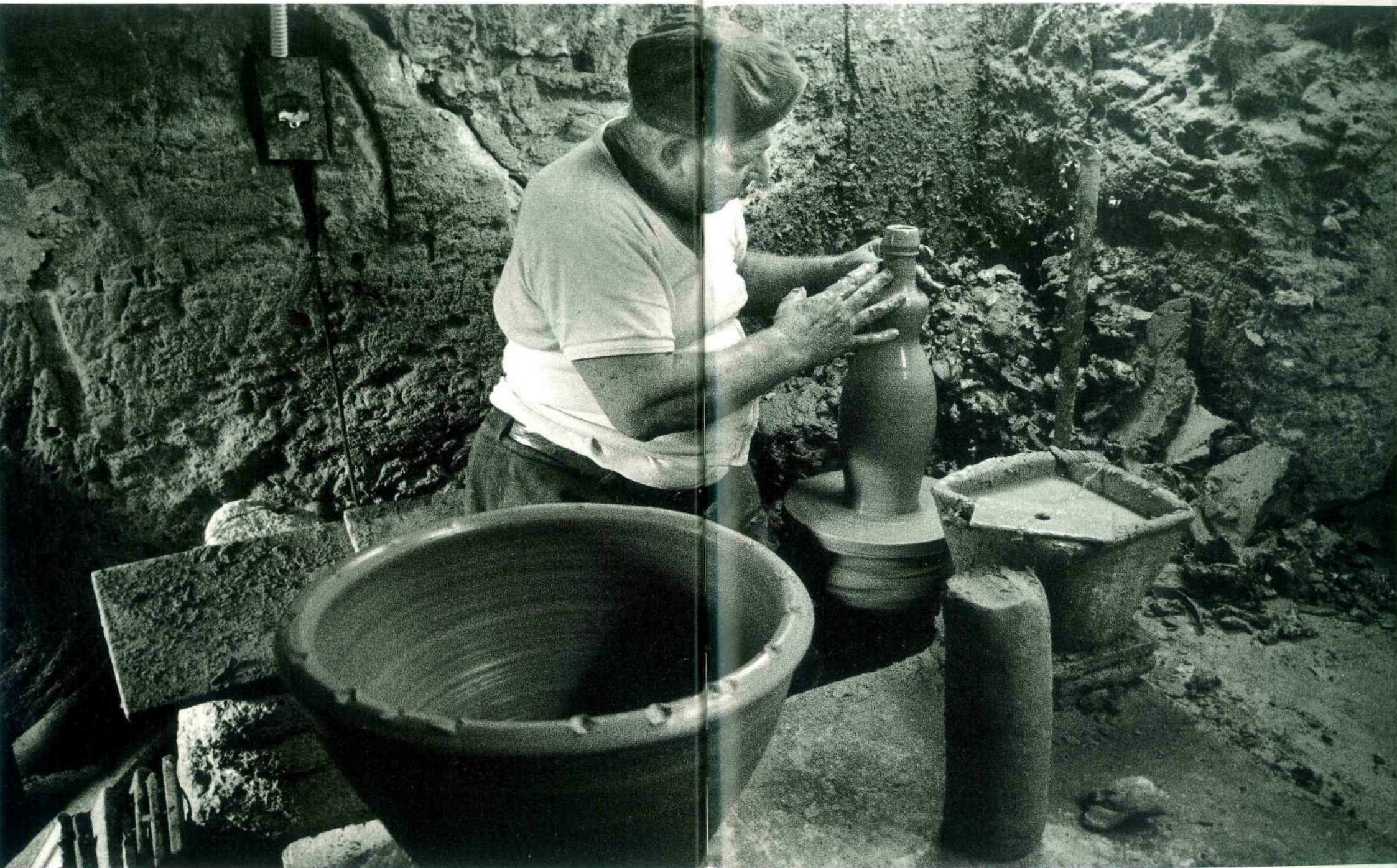
Fav. LII - Mazara del Vallo. Mastro d'arte figulina al tornio.