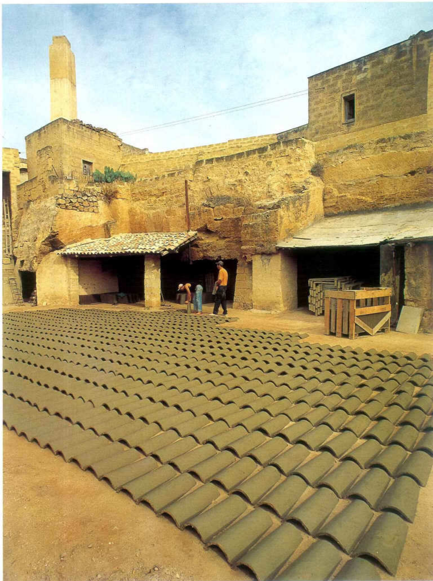
Tav. LIV - Mazara del Vallo. "Stazzuni".