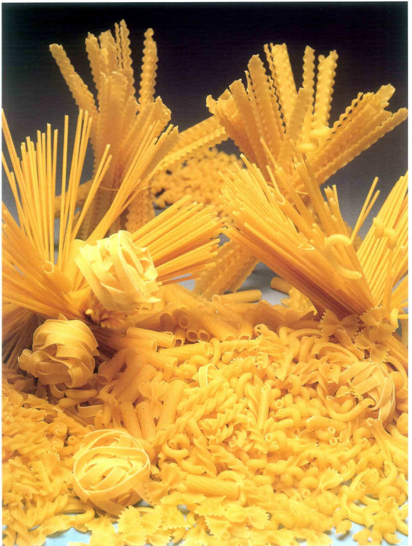
Tav. L - Mazara del Vallo, Pasta prodotta da opificio industriale.