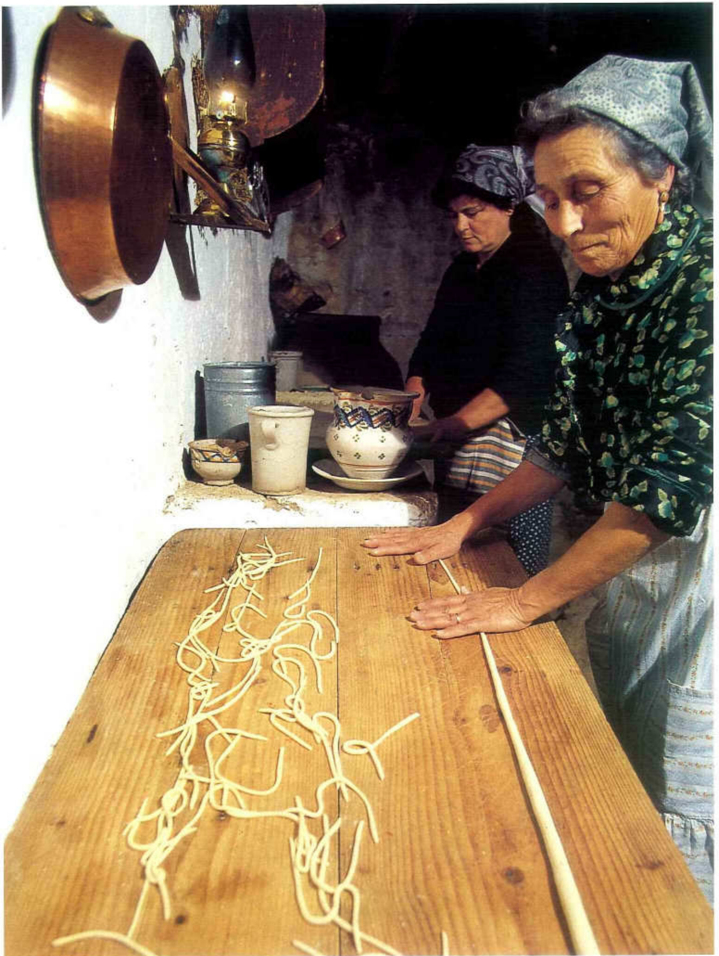
Tav. LI - Custonaci. Preparazione di pasta casereccia.