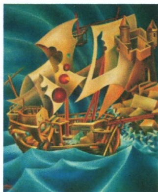
Ultima Incursione Saracena