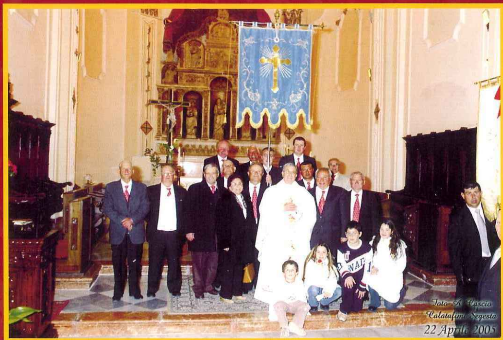
Calatafimi Segesta 22 Aprile 2005