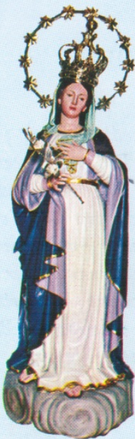
MARIA SS. DELLA PURITÀ