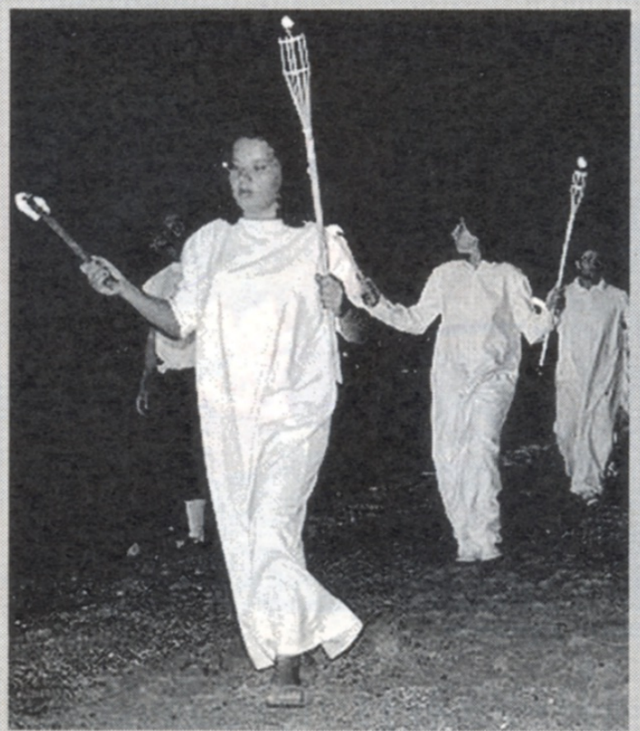
Una scena della rievocazione storica di una passata edizione