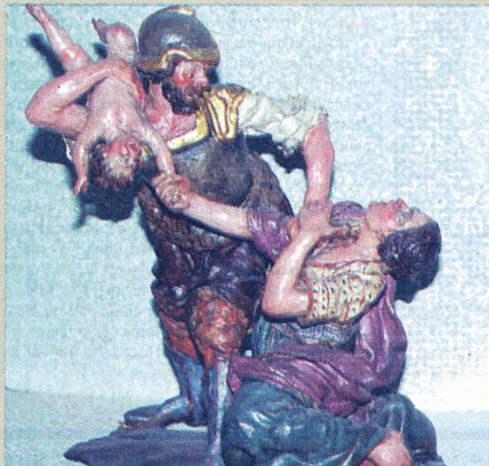
«La strage» custodita nel Museo Pepoli