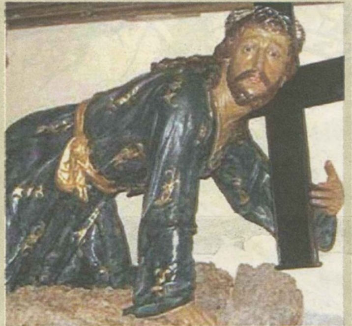
La statua del Cristo che trasporta la croce