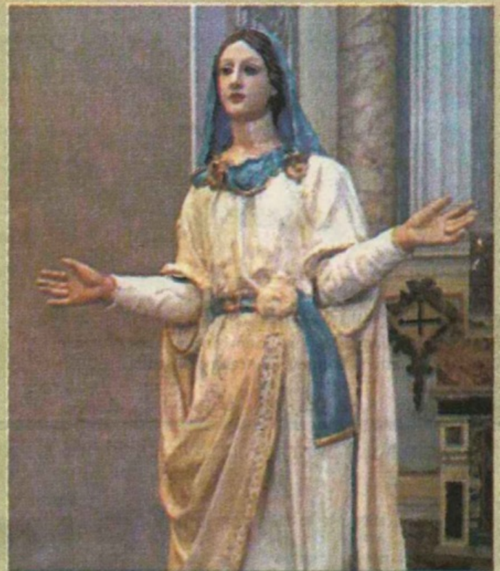
Il simulacro della Madonna