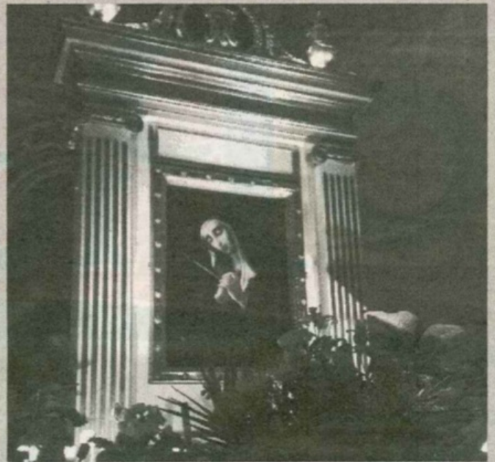
Il quadro della Madonna della Pietà