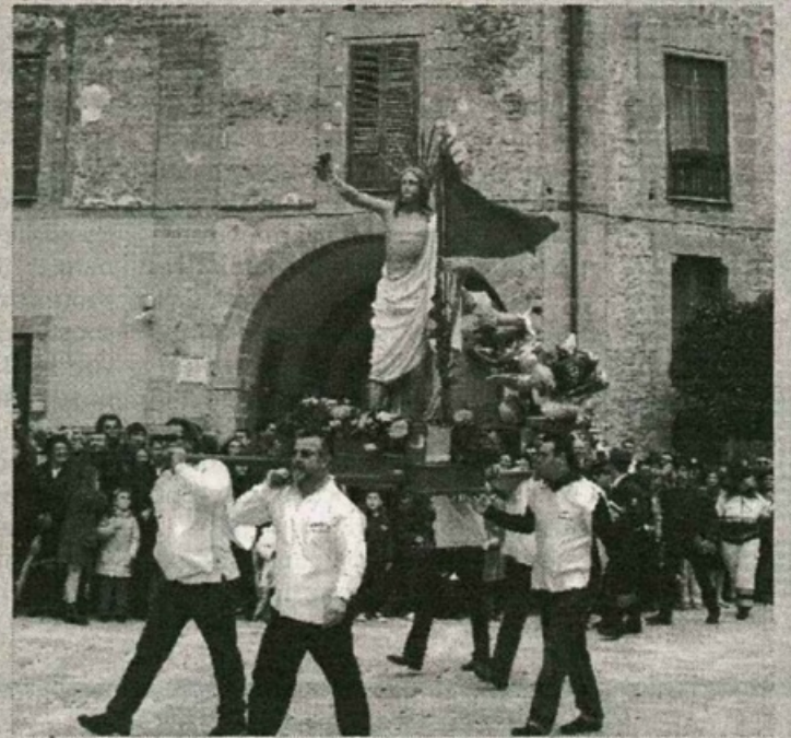
Il simulacro di Gesù Risorto