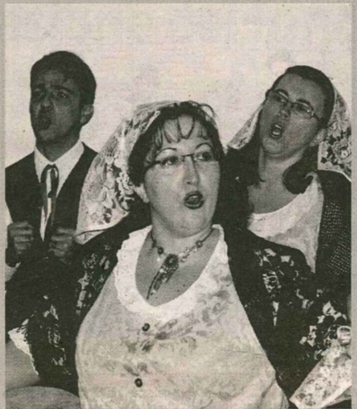
Il gruppo folkloristico Ciuri d'Acantu