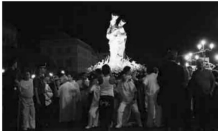
La statua della Madonna di Trapani in processione

La quindicina è stata introdotta intorno al 1579, a seguito di un'indulgenza concessa da Papa Gregorio XIII. Nella mattinata di ieri, festa della Madonna di Trapani, è stato celebrato il Pontificale del vescovo Francesco Miccichè nella basilica dell'Annunziata davanti a numerosissimi fedeli, che al termine della quale si sono recati nella cappella della Madonna a renderle omaggio. Il vescovo, nella sua omelia, ha parlato dei giovani che crescono senza punti di riferimento certi, vuoti dentro e senza ideali, senza la coscienza retta dai valori veri della fede. «Sono giovani, prosegue Miccichè, che chiedono attenzione anche attraverso i