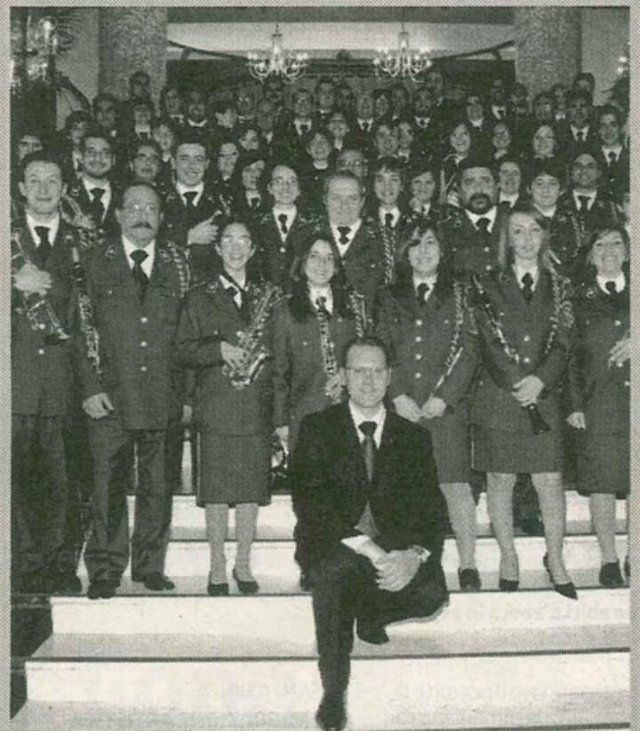
La banda musicale Città di Paceco