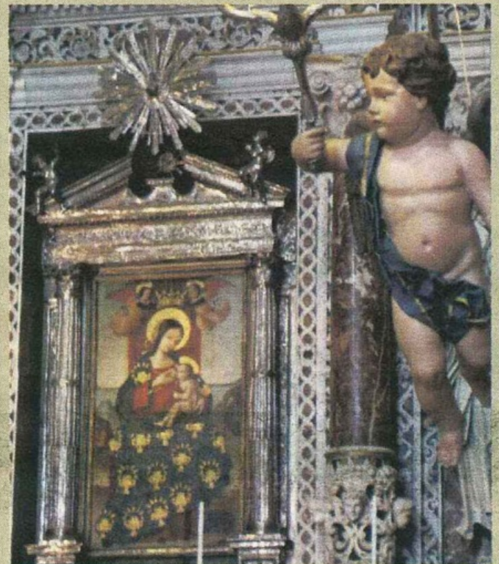
L'icona di Maria Santissima di Custonaci